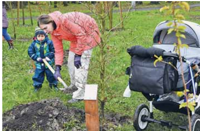
DO VÝSADBY se s oblibou zapojují i děti.

Dub, buk nebo třešeň. Právě z těchto tří druhů stromů si mohli lidé vybírat. Ještě před samotnou výsadbou dostali od vedení obvodu certifikát a poté se všichni přesunuli na místo, kde si svůj strom sami zasadili. Akce probíhá dvakrát do roka, a to vždy před 1. májem a na konci října, a zájem o ni je velký. Vše je připravováno ve spolupráci se společností Ostravské městské lesy a zeleň a rodiny, které se budou chtít zapojit do výsadb, zaplatí poplatek 800,- Kč za strom formou daru této společnosti.