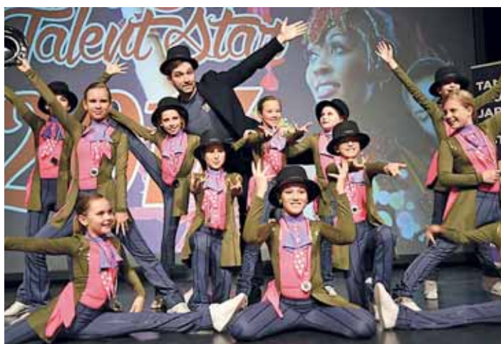
CELOU AKCÍ účinkující, hosty a porotu provázel herec, moderátor a bavič Ondřej Sokol. Na fotografii s jedním ze soutěžních týmů. Soutěžících se během dvou dnů vystřídal na 200.