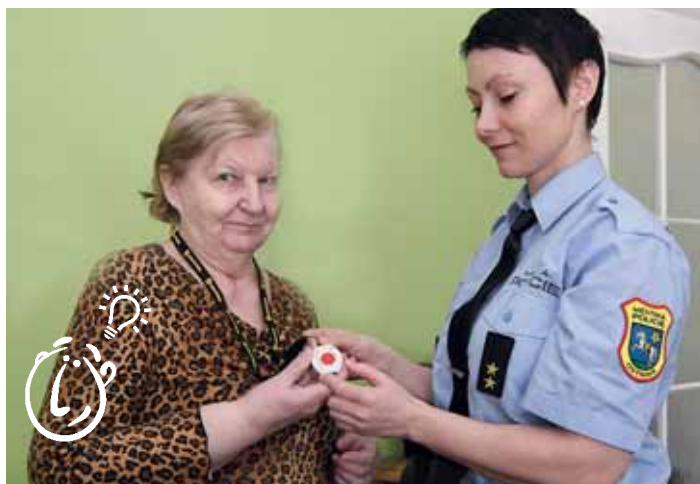
NOVÁ MAJITELKA seniorlinky se může cítit bezpečně.