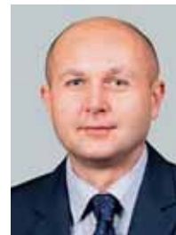
Martin Bednář starosta ANO

Dnes je stále prostor k jednání, protože vlastník je významným majitelem prosperujících nemovitostí v našem obvodu a jistě mu není lhostejné jeho dobré jméno mezi občany i na radnici.