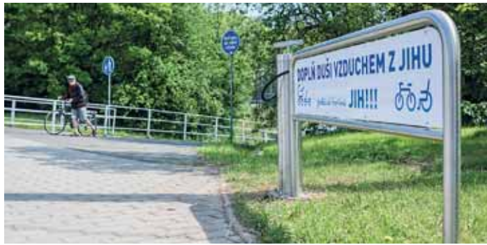
MÍSTO, kde si zájemci mohou přifouknout duši.

Manuálně a uživatelsky nenáročnou pumpu z nerezu mohou využívat nejen cyklisté, ale poslouží i koloběžkářům, maminkám s kočárky či lidem na invalidním vozíku. Pumpa je vybavena multifunkční hlavou. Měla by tak být