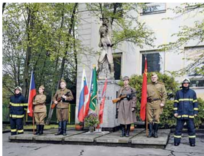
29. DUBNA si zástupci obvodu Ostrava-Jih připomněli 72 let od osvobození Ostravy.