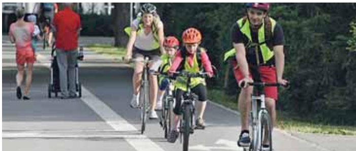
DĚTI potřebují vnímat kolo jako zpestření a zábavu na své každodenní cestě

Již druhý ročník soutěže Do školy na kole se rozběhl v květnu v Ostravě. Do soutěže se přihlásilo 7 základních škol. Soutěž je určena dvojicím žáků nebo žákyň 9. tříd základních škol a má motivovat ke změně životního stylu. Soutěžilo se celý měsíc ve dvou kategoriích