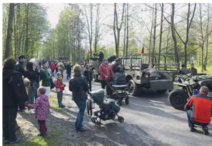
DNE 30. DUBNA přijela do Bělského lesa vozidla z druhé světové války. Na své bojové cestě zaimila 2. Tanková brigáda také na Jih, abych ukázala svých 5 historických vozidel. Akce se těšila hojně účasti.