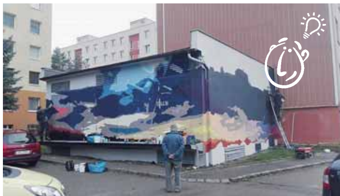
JDEME DO TOHO? I na Jihu máme šedé trafostanice!

Ostrava – kromě „Společně tvoříme Jih“ je zde ještě „Zelená Porubě“ a „Radnice pro lidi“ obvodu Mariánské Hory a Hulváky. Tam vítězila hřiště, ale také „Ozdobná kašna před kostelem v Mariánských horách“ a tak jako u nás na Jihu se prosadily také seniorlinky. Specifikem „Radnice pro lidi“ byl velký počet návrhů na akce – od uspořádání hudebního festivalu přes výchovné koncerty pořádané cimbálovou muzikou, taneční workshopy, festival adventních a vánočních zvyků a sportovní akce – turnaj ve stolním tenise a turnaj fotbalových školiček, až po Dny zdraví. O projektech v Porubě jsme vás už informovali v minulých číslech, aktuálně zde probíhá přihlašování projektů do 2. kola.