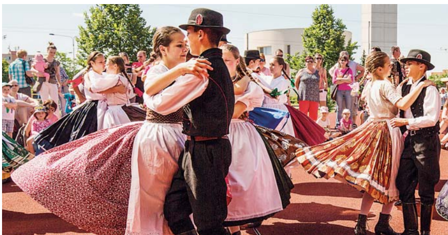
PŘED KINEM Luna předvedli své umění děti z folklorního souboru Holúbek.