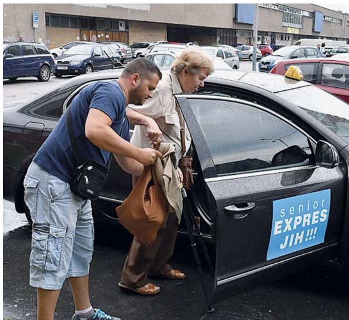
MILÝ ŘIDIČ vždy pomůže s nástupem do vozu, zdravotními pomůckami či třeba nákupem.

■ Tři měsíce již využívají senioři našeho městského obvodu Ostrava-Jih služby Senior EXPRESU.