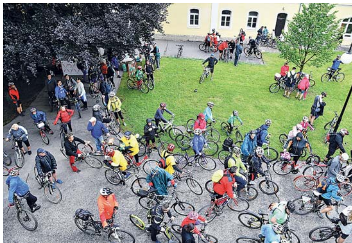
NA DVĚ STOVKY cyklistů projelo společně se starosty trasu dlouhou přes 28 km.