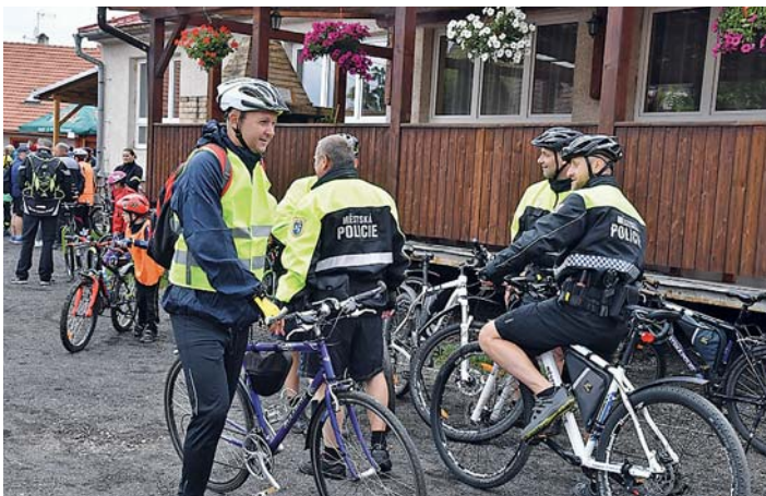
PRVNÍ ROČNÍK cyklojízdy „Léto na kole“ se uskutečnil v sobotu 17. června a trasa vedla přes dalších pět obcí a obvodů.