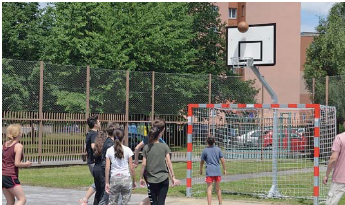
NEJPOPULÁRNĚJŠIMI projekty jsou jednoznačně dětská hřiště a sportoviště.

Přeměna vyšlapané pěšiny přes trávník na regulérní chodník. Je to specifické a opakující se téma – pro participativní rozpočet vhodné, záleží však