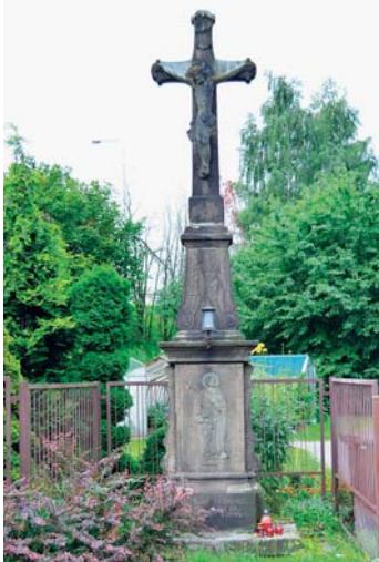
KŘÍŽ z roku 1866 před restaurací.

■ Zábřežské kříže patří do souboru církevních památek, který je rozprostřen po historickém centru původní samostatné obce. Kromě tří kamenných křížů zde nalezneme dvě kapličky, kostel Navštívení Panny Marie. Dochovala se také socha svatého Floriána, patrona hasičů. Soubor církevních památek se nám dochoval v torzu – mnohé kříže a dvě kapličky byly v průběhu 20. století odstraněny. Dobrou zprávou však je, že se dochované památky v posledních letech dočkaly opravy. Právě v těchto dnech byla dokončena restaurace dvou starých křížů.