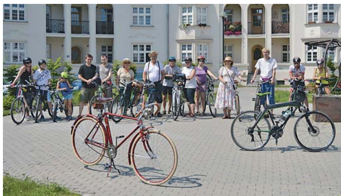
ÚČASTNÍCI nepravidelné Cyklistické jízdy obvodem Ostrava-Jih v Jubilejní kolonii.