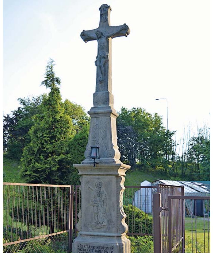
KŘÍŽ na Starobělské ulici je jako jediný z tří dochovaných křížů evidován jako kulturní památka.

Nejstarší zábřežský kříž nalezneme vlevo od hlavního vchodu do kostela Navštívení Panny Marie. Jedná se o pískovcový kříž s motivy Panny Marie, prostřední díl je pokryt nástroji Kristova mučení (kameny, svítlna, kladivo, kleště, pochodeň, kopí, tyč s houbou namočenou v octu). Vrchní díl tvoří samotný ukřižovaný Kristus. Kříž získala zábřežská lokálie od neznámého dárce roku 1858. Památka prošla restaurací již v minulých letech.