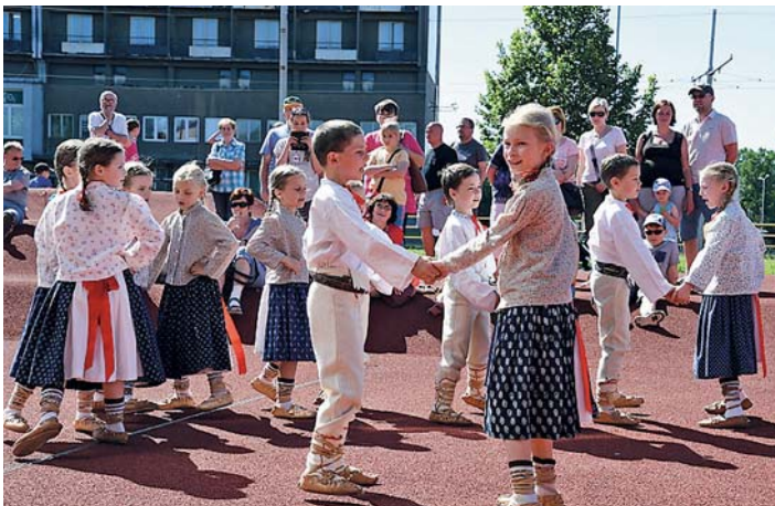
PŘED KINEM Luna proběhl 2. června Den dětí, kde zatančily i děti z folklorního souboru Holúbek.