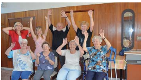
SENIORŮ se na své pravidelné cvičení těší.

„Rehabilitační hodiny jsou přizpůsobeny možnostem a potřebám zájemců. Cílem je nejen uvolnění a upevnění tělesné kondice, ale také vzájemná přátelská konverzace a příjemně strávený