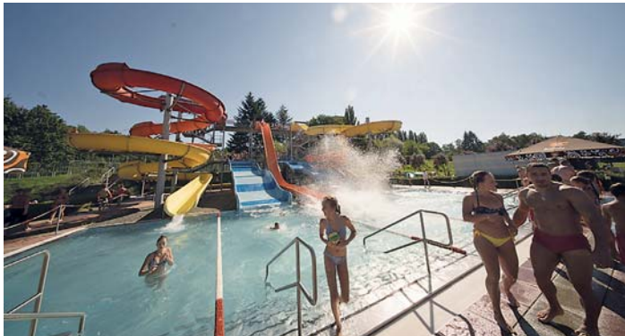
VE VODNÍM AREÁLU Jih najdete mnoho relaxačních a sportovních atrakcí

Vodní areál Jih byl otevřen v roce 2006 a najdete jej v těsné blízkosti Bělského lesa. V samotném vodním areálu si přijdou na své děti i dospělí. Pro zdatné plavce je tady k dispozici padesátimetrový bazén se šesti plaveckými dráhami. Okolo nich jsou rozmístěna lehátka, sloužících k opalování a relaxaci. Oblíbený je rovněž relaxační bazén, jehož součástí je vodní a vzduchová masážní lavice, kde se můžete nechat masírovat, dále dnová masáž a perlička. Jedinečnou atmosféru koupaliště dotváří dvě šestnáctimetrové skluzavky, dvacetimetrová strmá skluzavka „kamikadze“ a otevřeně