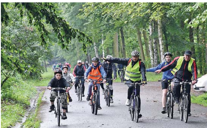
ZE STARÉ BĚLÉ projeli cyklisté přes Krmelín, Novou Bělou, Paskov a Hrabovou až do lesní školky v Bělském lese.