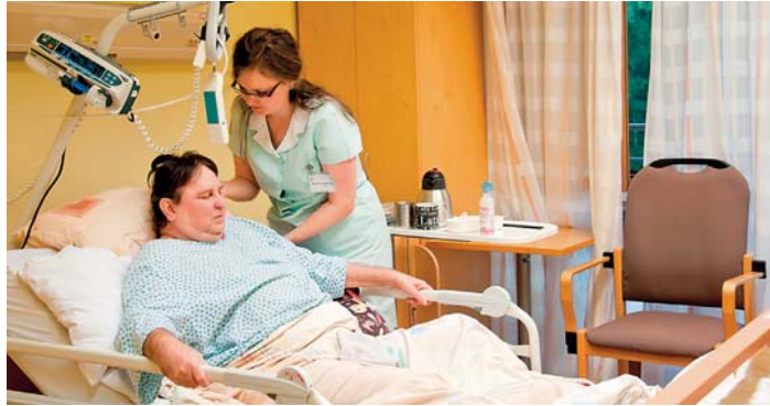
POSILÁNÍM HOSPICE sv. Lukáše je poskytování specializovaných zdravotních hospicových služeb.

Hospic sv. Lukáše nabízí specializovanou zdravotní péči lidem v závěru života. K hospicové paliativní péči jsou přijímáni klienti, u kterých již byly vyčerpány všechny možnosti léčby základního onemocnění. Péče v hospici sv. Lukáše je hrazena ze zdravotního pojištění, příspěvků klientů na úhradu fakultativních služeb a z darů. Mezi základní principy přístupu personálu a poskytované péče patří úcta k člověku jako jedinečné bytosti, vytváření důstojných podmínek pro závěr života a lidský přístup. Intenziv-