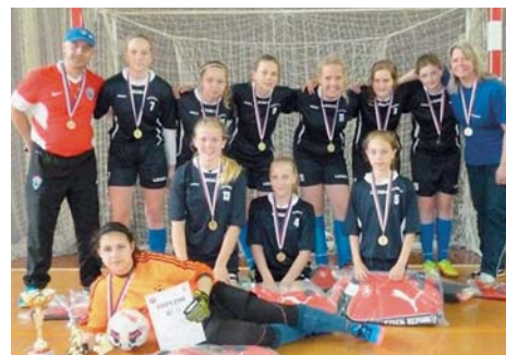
VÍTĚZNÝ TÝM ZŠ Klegova.

Odkaz na oficiální stránky: https://mcdonaldscup.cz/novinka/id/76 .