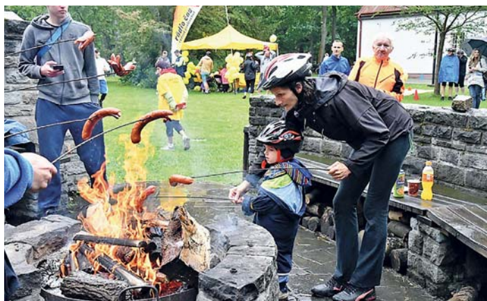
OPĚKALI SE klobásy, hrála muzika a všichni si novou akci „Léto na kole“ pochvalovali.