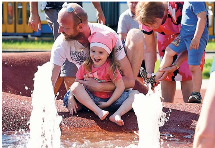
DEN DĚTÍ na Jihu byl ve znamení zábavy a horkého počasí.