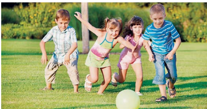
BEZPEČNOST dítěte je pro každého rodiče prioritou.

V ideálním případě by měly být děti v době, kdy jsou doma bez rodičů, zaměstnány činnostmi, které je neohrožují. Děti by měly být také poučeny o tom, jak se v této době chovat. Přístup k telefonu společně s telefonními čísly na policii, hasiče a záchranáře je v dnešní době již standardem. Také by neměly nikomu cizímu otevírat dveře, naopak vždy by měly děti využívat bytové kukátko a bezpečnostní řetězky na dveřích k tomu, aby se přesvědčily, kdo se za dveřmi nachází. Určitě by neměly skutečnosti o tom, že jsou doma samy, sdělovat nikomu na sociálních sítích. Svě kamarády si zvat domu pouze se svolením rodičů. Rodiče by se měli vždy přesvědčit, že dítě porozumělo