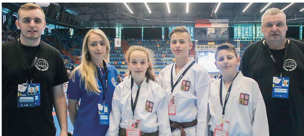
MISTROVSTVÍ Evropy SKIEF.

Lázeňský pohár v karate, který se konal 13. 5. 2017 v Karlových Varech nenechali karatisté bez povšimnutí, vybojovali zde ve třech závodnících celkem 4 medaile – 1-1-2, na turnaji klub