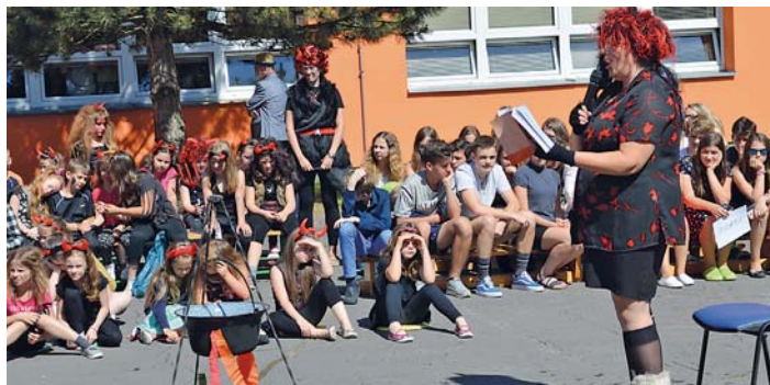
ČERTI A ČERTICE se sešli na ZŠ Horymírova při slavnostním křtu knihy „Čertovské pohádky z Horymírky“.

Žáci a učitelé přišli tento den v čertovském, autoři a autorky ve společenském oděvu. Knih bylo vydáno 130 kusů. Každý autor pohádky obdržel knihu, zbylé knihy budou dostupné ve školní knihovně k zapůjčení.