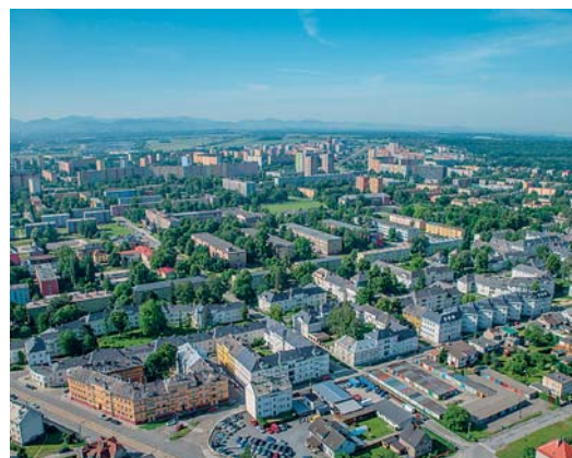
POHLED Z NEBES neomrzí, podívejte se na Jih z výšky.

Program Místo pro život se snaží podpořit aktivity, které povedou ke zlepšení životního prostředí, zvelebování míst, které jsou využívány k rekreaci, kultivaci veřejného prostoru atd. „Program je určen především pro ekologické organizace, okrašlovací spolky, pořadatele úklidových akcí apod.,“ uvedl starosta. Přihlášky lze podávat do 15. července 2017. Max. výše daru (poskytováno na základě darovací smlouvy) je 75 tis. Kč.