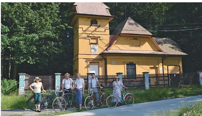
SKUPINKA DOBOVÝCH cyklistů na okraji Bělského lesa.