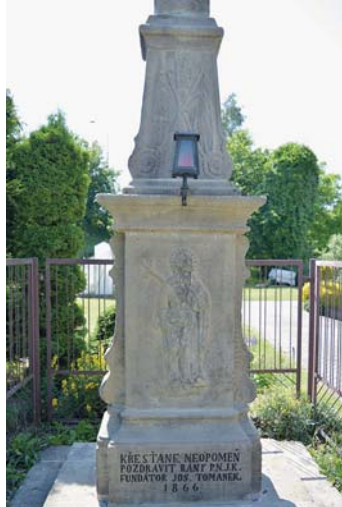
DETAIL kříže po opravě.