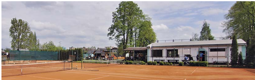
POHLED z kurtu č. 2 na část areálu: Zprava doleva: správní budova, trámový pavilon, dětský koutek.

■ Zdá se vám váš život fádni a toužíte po zážitcích, které vám jako tmou tlumené výbuchy špuntů, vysvobozovaných z lahvi šampaňského, budou ve vzpomínce jemně bubnovat do usínání?