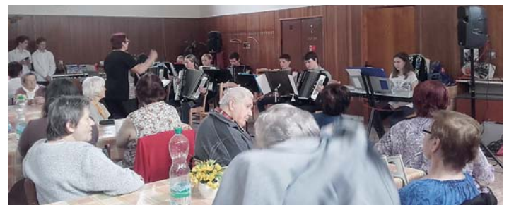
UČITELÉ A ŽÁCI ZUŠ V. Petrželky si připravili pro členy klubů seniorů vystoupení k příležitosti Svátku matek.

Vystoupení mladých interpretů bylo pestré. Své nadání a píli předvedly děti hrou na hudební nástroje, zpěvem i tancem. Přispěli tak ke slavnostní náladě nás všech.