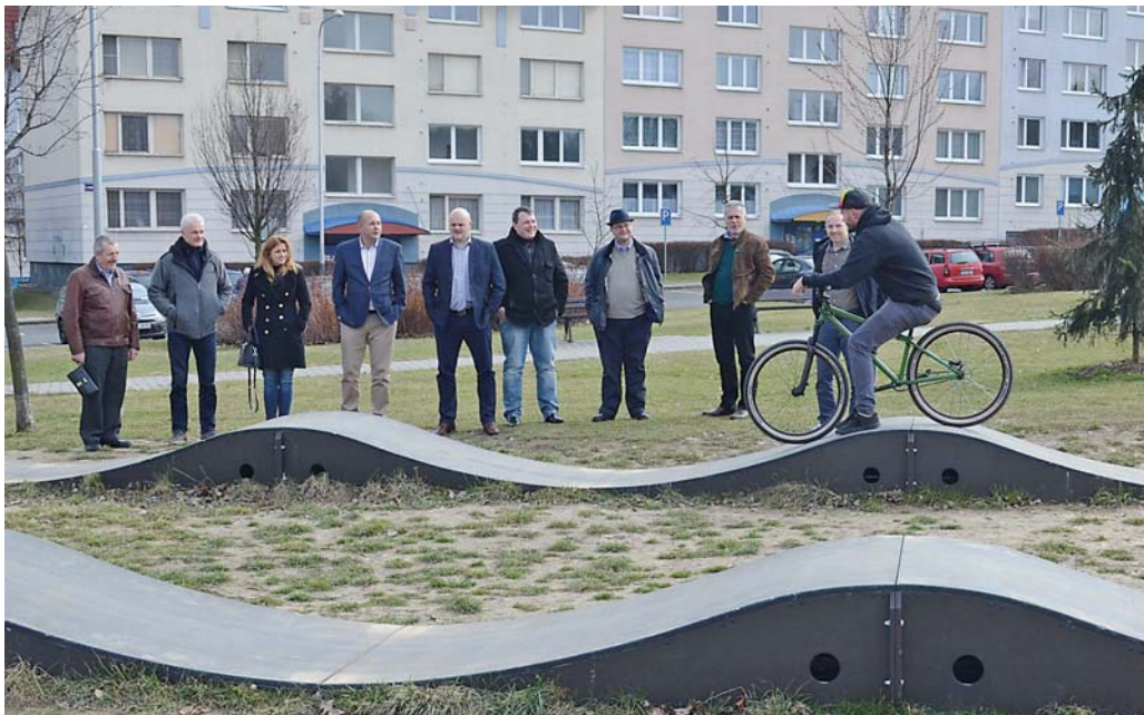
Představitelé partnerského města Košice – Západ si v rámci svého pobytu na „Jihu“ prohlédli i pumpruckovou dráhu v Bělském lese, která je nejdelší v České republice. (více na straně 24)