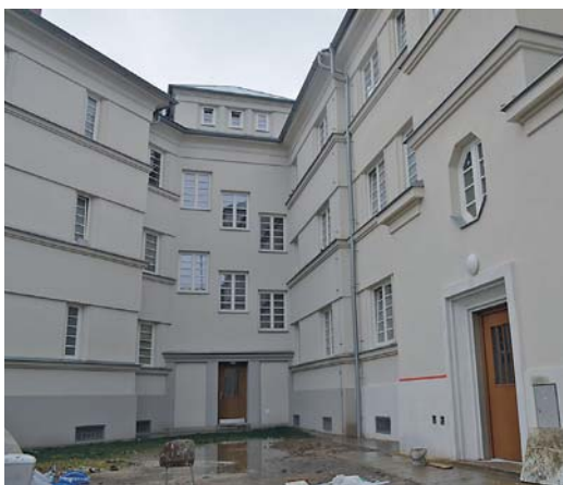
Dům na Velflíkové ulici v Jubilejní kolonii před rekonstrukcí a po ní nepotřebuje další komentář.