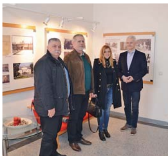
Košičané se byli podívat i v Komorním klubu. (js)

Podívali se také do Landek parku a prohlédli si řadu sportovišť a kulturních zařízení, včetně Bělského lesa. Během své třídní návštěvy si se svými ostravskými kolegy vyměnili mnoho poznatků a zkušeností.