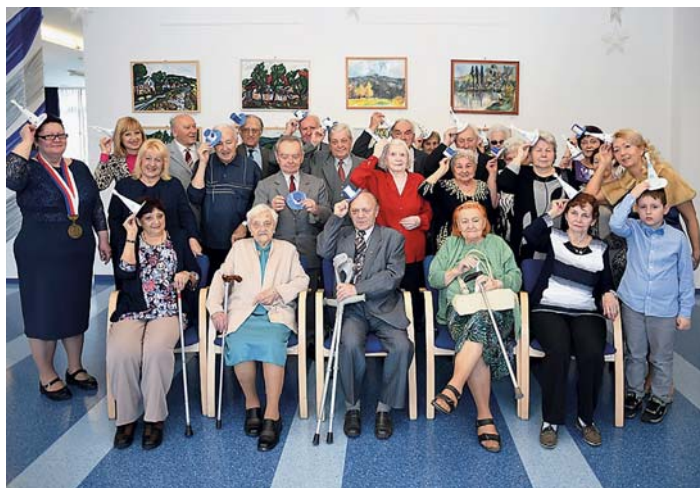
Na pravidelná setkání v K-Triu se jubilanti těší. Obvod pro ně pokaždé nachystá nějaké malé překvapení ve formě kulturního představení a malého dárku. Tentokrát se všichni vyfotili v roztomilých kloboučcích.

„Mám ráda tato setkání, navážeme tady mnohá přátelství, lidé, kteří se tady sejdou, jsou totiž z různých koutů obvodu a většinou se neznají. Já si tady loni našla kamarádku a od té doby se navštěvujeme, jezdíme na výlety, občas zajdeme na kafičko,“ říká pětadesátiletá paní Alena. (sy)