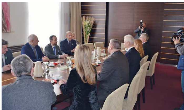
Při jednání u ostravského primátora.