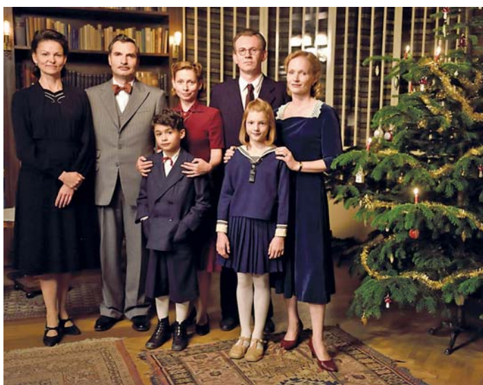
Na film Zahradnictví a Rodinný přítel se diváci mohou těšit 27. dubna v 17:45 a ve 20 hodin. Filmová trilogie ZAHRADNICTVÍ vypráví o třech rodinách: rodině leteckého radiotelegrafisty, rodině majitele kadeřnického salonu a rodině majitele zahradnictví.

Pokud jste to tentokrát nestihli, také v měsíci dubnu nabízíme atraktivní a žhavé tituly. Začneme pozvánkou na připravované dva přenosy z Metropolitní opery (MET) New York na velkém filmovém plátně, přičemž ušetříte za letenku. Zveme vás v neděli 2. dubna 2017 od 16 hodin na inscenaci Mozartova Idomenea, která se na jeviště MET vrací po více než deseti letech, a už proto stojí za vidění. Druhoo operní pozvánkou do MET dne 30. dubna 2017 od 16 hodin je od P. I. Čajkovského - Eugene Onegin, kde operní hvězda Anna Netrebko vystoupí v jedné ze svých stěžejních rolí – jako