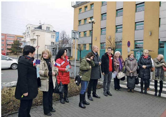
Do Ostravy přijeli zástupci z polského Wodzisława Śląskiego, aby poznali, jak to chodí v mateřských školách na „Jihu“.

V městském obvodu Ostrava-Jih se organizátoři zaměří především na problematiku výuky technických a přírodovědných předmětů v mateřských školách. „Děti a pedagogové z Polska navštíví například pavilón Svět techniky v Dolní