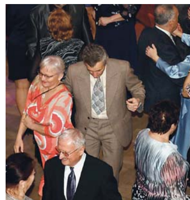
O ples seniorů v KD Akord byl velký zájem. Všichni dříve narození se po skvělém programu rozcházeli do svých domovů s úsměvem na rtech.

Ples slavnostně zahájili všichni patroni plesu, následovalo předtančení v podání profesionálního tanečního páru, k tanci hrála skupina Klasik, nechybělo ani vystoupení mažorettek či orientálních tanečnic.