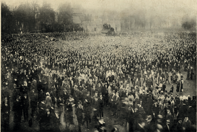
Shromáždění lidu v Moravské Ostravě při oslavách vzniku Československé republiky v roce 1918.