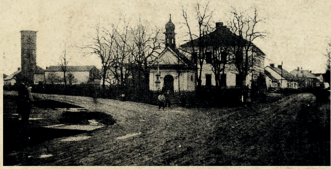
Kaple Panny Marie Čenstochovské na rozcestí v Hrabůvce, před níž byla vysazena v roce 1919 lípa svobody.