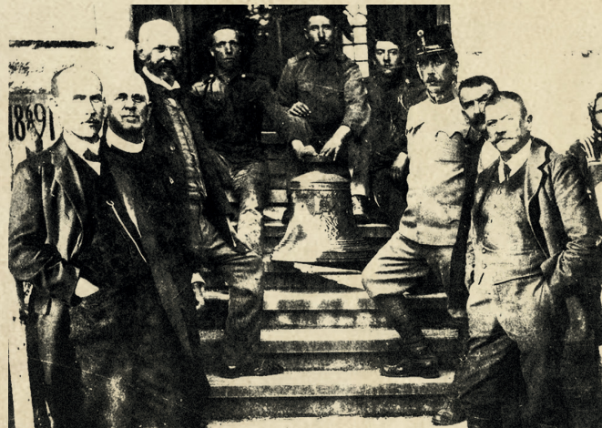
Rekvizování zvonu Jaroslav ve výškovické kapli Nanebevzetí Panny Marie, 25. září 1916.