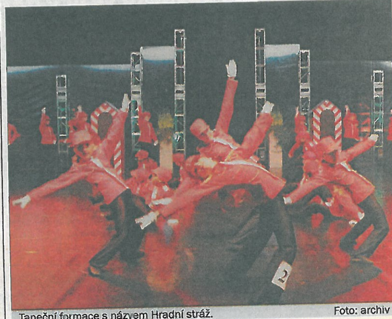
Taneční formace s názvem Hradní stráž.