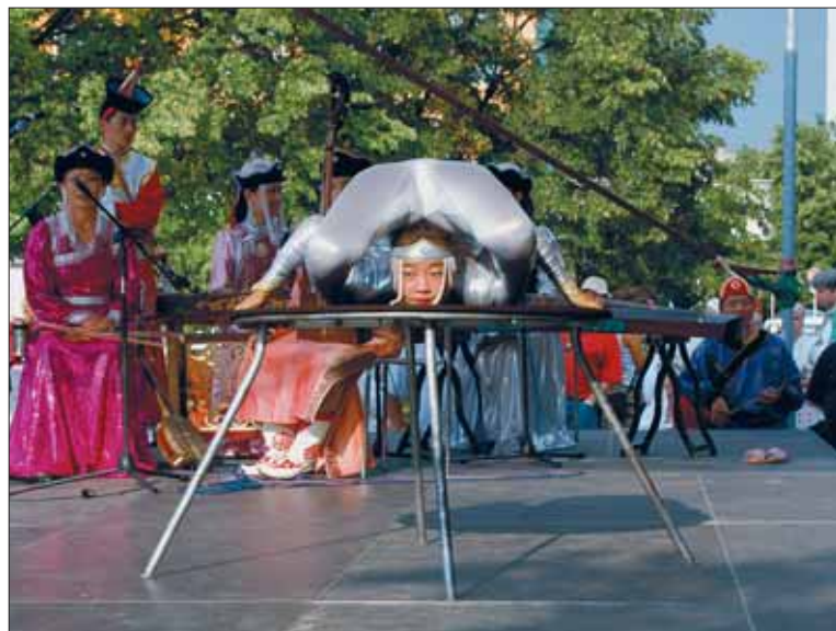
Početné publikum nejvíce zaujalo vystoupení jednadvacetileté „hadí ženy“ z mongolského souboru Khulan Khongor.

Soubor Khulan Khongor z Mongolska skutečně sklídl největší aplaus publika. Mongolské lidové divadlo, složené ze studentů univerzity z hlavního města Ulanbátaru, zahrálo na tradiční mongolské nástroje. „Jeden z nich, jmenuje se Morin Khmer, byl dokonce před čtyřmi lety zapsán na listinu světového kulturního dědictví UNESCO,“ zdůraznila tajemnice festivalu Renáta Huserová.