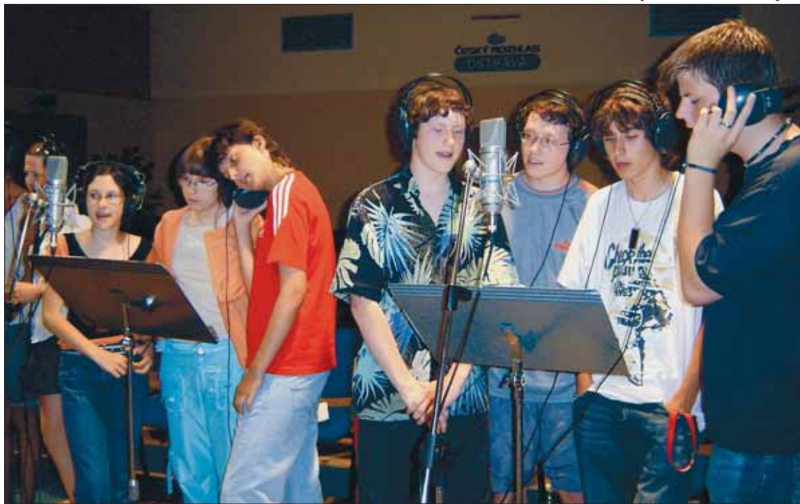
Mendíci patří k nejlepším dětským souborům v Ostravě.

V září bude dětský pěvecký sbor Mendíci přijímat do svých řad nové členy, kterými jsou především žáci z hudebně zaměřených tříd Základní školy na Krestově ulici v Hrabůvce. V příštím školním roce sbor připravuje oslavy patnáctiletého výročí svého založení. K této příležitosti uspořádá v Ostravě slavnostní koncert s mezinárodní účastí, jehož finanční zabezpečení bude vyžadovat nemalé částky. Rádi bychom proto vítali případné sponzory, kteří našemu snažení fandí a kteří budou ochotni se finančně (nebo i jinak) podílet na naší činnosti. (YL)