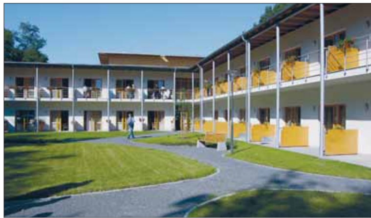
Pacienti najdou v areálu příjemné prostředí v podobě klidu a zeleně.