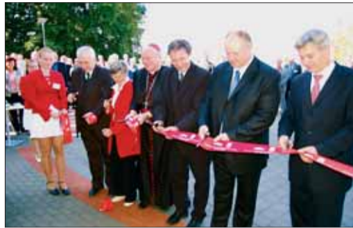
Slavnostní přestřižení pásky v podání čestných hostů

V pondělí 17. září byl slavnostně otevřen Hospic sv. Lukáše ve Výškovcích, který je prvním zařízením svého druhu v Moravskoslezském