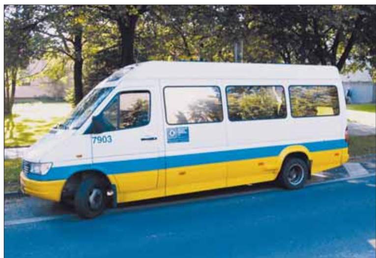
Na ulici Volgogradská v Zábřehu bude vybudována nová zastávka.

S novým jízdním řádem, který vejde v platnost desátého prosince, vyjede napříč městským obvodem Ostrava-Jih minibusová linka číslo 96. V nejlidnatějším ostravském obvodu má vyřešit tzv. „hluchá“ místa a zejména vylepšit dostupnost významných institucí.