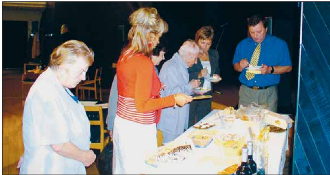
Porota měla těžký úkol, vybrat ten nejlepší recept nebylo snadné.