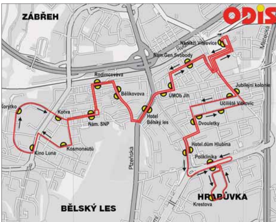
Mapka znázorňující trasu minibusu ostravským obvodem Jih, pojmenovány jsou názvy jednotlivých zastávek. Mapa: DP Ostrava

Minibus bude jezdit od 10. prosince v rámci půlročního zkušebního provozu. Celou trasu by měl absolvovat zhruba za pětadvacet minut. Počítá se s každodenním provozem přibližně od sedmi do šestnácti hodin, spoj bude jezdit v hodinovém intervalu. Minibusová linka v Ostravě-Jihu se přiřadí ke stávajícím čtyřem, které v městě dopravní podnik zajišťuje. Michael Kutty