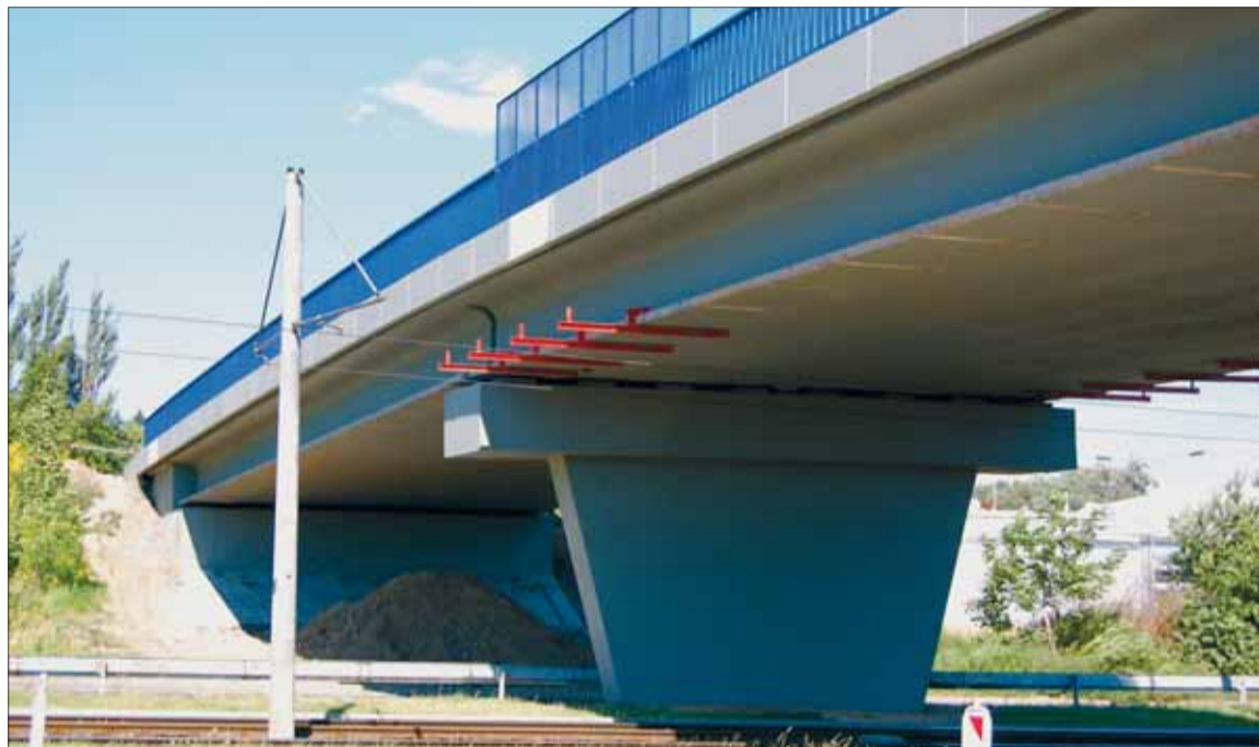
Motoristé už opět mohou jezdit po zrekonstruovaném mostě na ulici Františka Formana na Dubině.

prostřední blízkosti mostu a opravy stávajícího zpevnění svahů pod mostem, které bylo doplněno o novou kamennou dlažbu. Současně se znovuo- tevením mostu došlo také ke spuštění světelné křižovatky při výjezdu na Plzeňskou ulici. (kut)