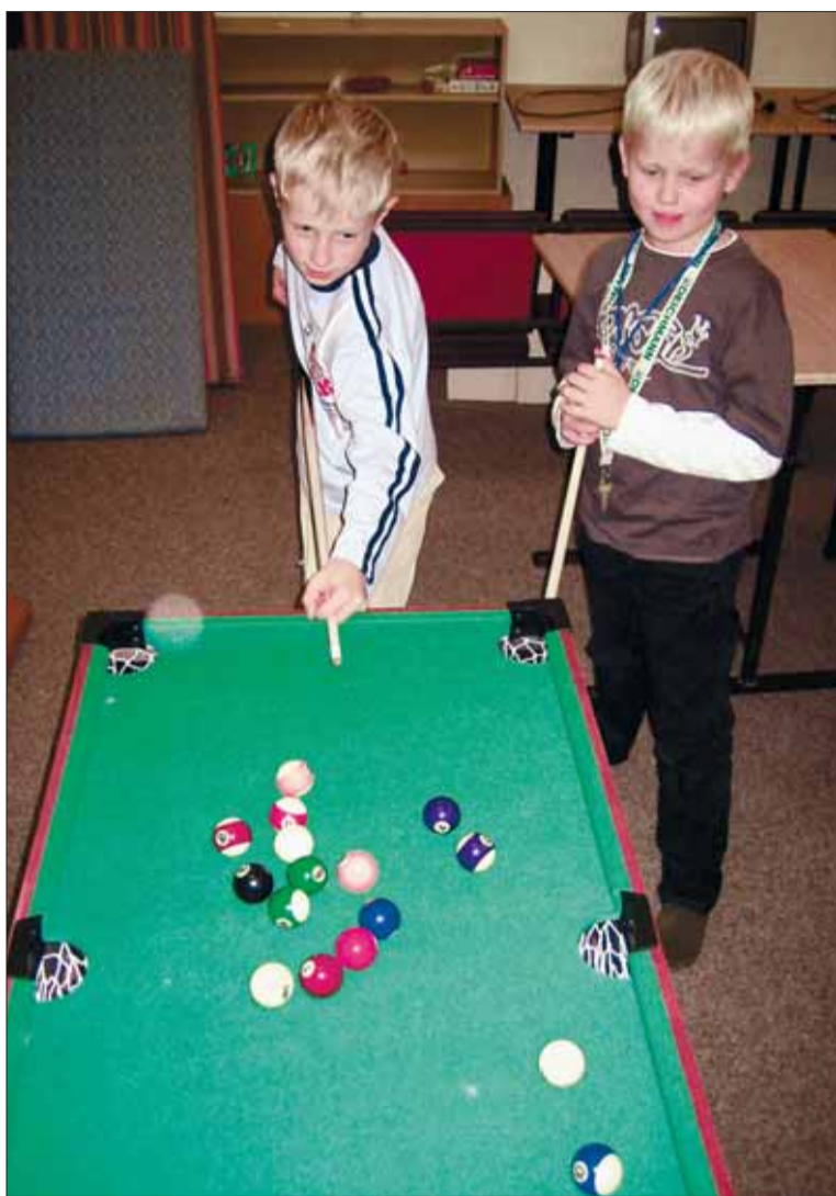
Klub U Krtka si děti velice oblíbily.

Také školní družina, podobně jako škola, pracuje podle originálního plánu s názvem Školní vzdělávací