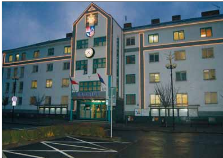
Do sváteční výzdoby se oděla také radnice ÚMOB Ostrava-Jih.