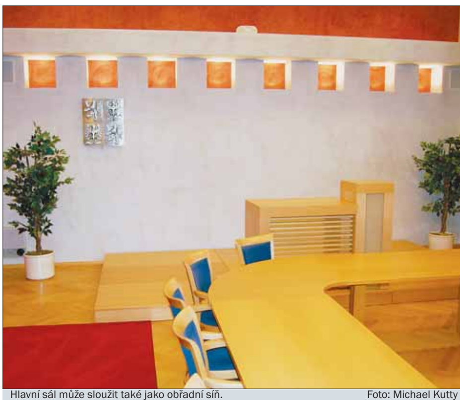
Hlavní sál může sloužit také jako obřadní síň.

Dům číslo 8 na Velfíkové ulici by od příštího roku mělo převzít do své správy známé kulturní zařízení K-TRIO v Ostravě-Hrabůvce. (kut)