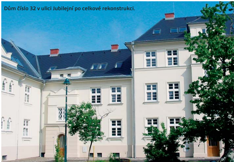
Dům číslo 32 v ulici Jubilejní po celkové rekonstrukci.

Jubilejní kolonie v Ostravě-Hrabůvce byla postavena na počest stoletého výročí trvání Vítkovického horního a hutního těžířtva v letech 1921-1932. Autor projektu, ostravský architekt Ernst Korner, uplatnil v tomto díle vliv expresionismu a dekorativismu vídeňské provenience. Jednalo se o sídliště o 605 bytech v jednopatrových a dvoupatrových domech. Jádrem urbanistické kompozice je ulice Jubilejní, na níž navazují krátké uliční spojky. Uzavřenost a kompaktnost celého areálu posilují symbolické motivy průjezdů v přízemích domů, domovní vchody ve věžových rizalitech a mnoho dalších charakteristických detailů.