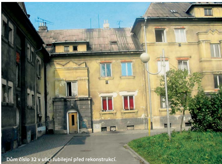
Dům číslo 32 v ulici Jubilejní před rekonstrukcí.

dřevěné obložkové zárubně, eurookna apod. Součástí rekonstrukce první etapy byla i technická infrastruktura - dětské herní prvky, parkovací stání, zeleň, chodníky a příprava na veřejné osvětlení. Po dokončení jednotlivých etap rekonstrukcí bytových domů se předpokládá provádění další postupné obnovy technické infrastruktury. „Chceme, aby se celá lokalita uzavřela a ohraničila ulicemi Edisonova, Provaznická, Horní a Závodní,“ uvedl starosta obvodu Ostrava-Jih Karel Sibinský.