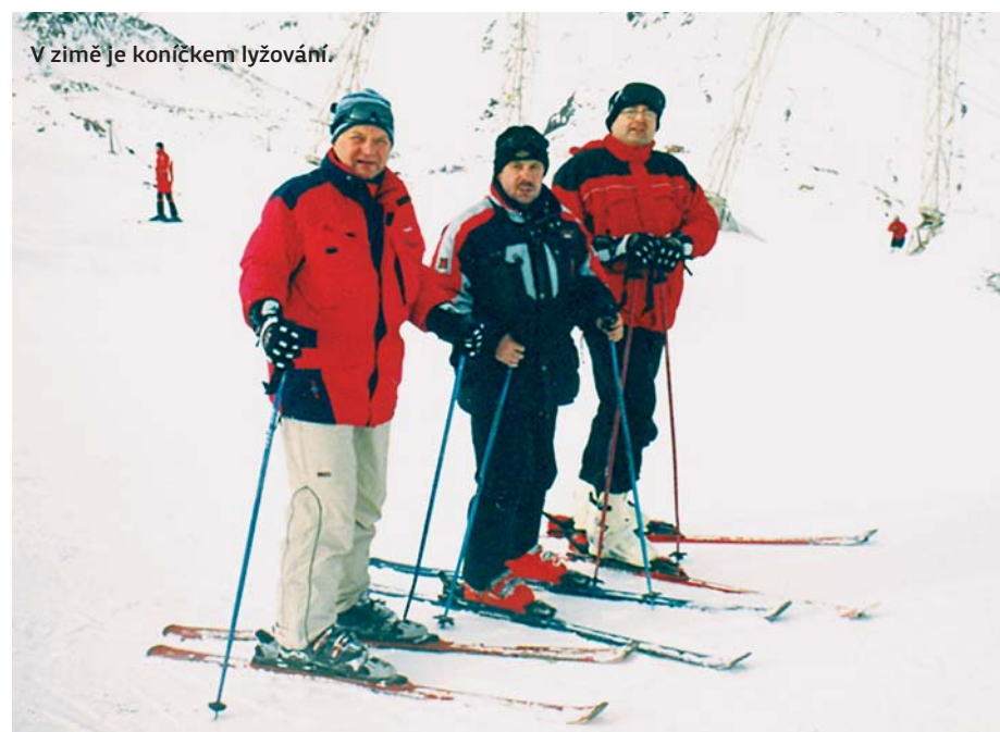
V zimě je koníčkem lyžování.

kluků, zpočátku byli dost agresivní, ale pak se to srovnalo. Říkali, že pro mládež by se v obvodu mělo dělat více. Nakonec jsme si dobře popovídali, byli to docela milí hoši.