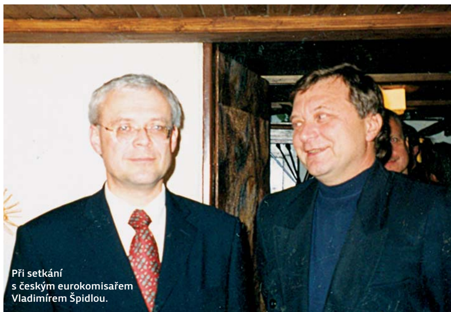
Při setkání s českým eurokomisařem Vladimírem Špidlou.

Jednou ano, identifikovala mě nějaká parta