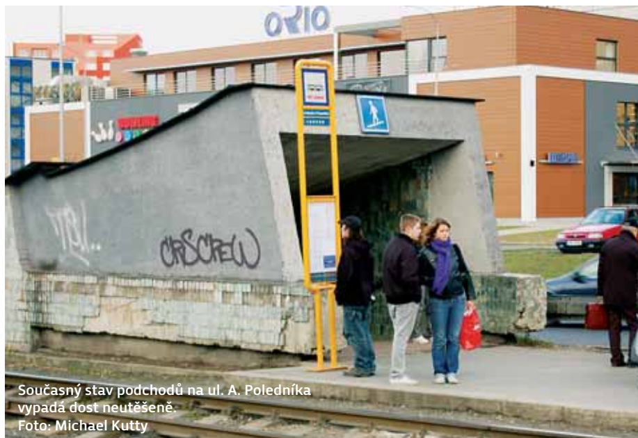
Současný stav podchodů na ul. A. Poledníka vypadá dost neutěšeně.

Po rekonstrukci podchodu na zastávce A. Poledníka na Dubině budou v dalších