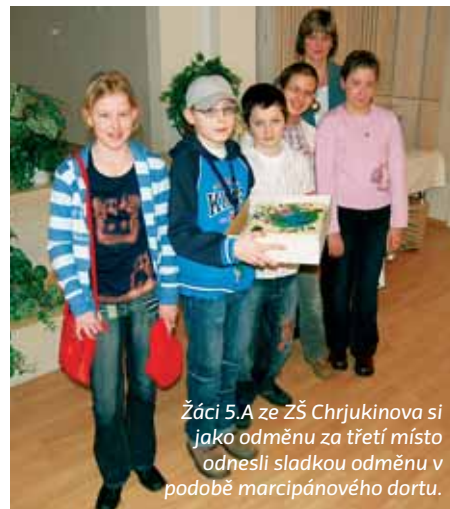
Žáci 5.A ze ZŠ Chrjukinova si jako odměnu za třetí místo odnesli sladkou odměnu v podobě marcipánového dortu.