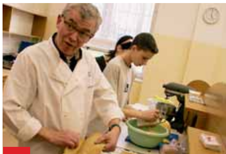
Francouzští studenti společně se svým pedagogem připravovali pro žáky a učitele Střední školy společného stravování v Hrabůvce typické francouzské palačinky.

Kromě pracovních činností měli stážisté i volnější program zahrnující nejen poznávání Ostravy, ale také seznámení s historií a kulturou Moravskoslezského kraje. „Ostrava je velké město, takže pro nás bylo zajímavé poznat během tří týdnů jiný životní styl,“ uvedl jeden z francouzských pedagogů. Studenty podle něj překvapilo, že v Ostravě nenašli žádný typický francouzský