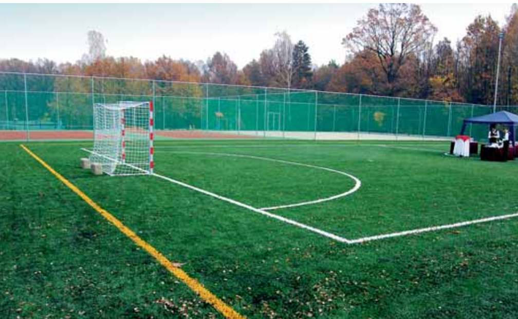
Návštěvníkům Vodního areálu Jih budou od příštího roku sloužit nově vybudovaná sportoviště.

V úterý 4. listopadu byla oficiálně ukončena realizace stavby Vodní areál Ostrava-Jih – sportoviště. Od příští sezony se návštěvníci mohou těšit na další novinky.