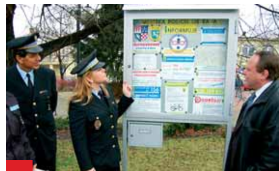
Tabule na náměstí SNP v Zábřehu.

„Věříme, že tento způsob komunikace mezi občany a městskou policií si najde své příz-