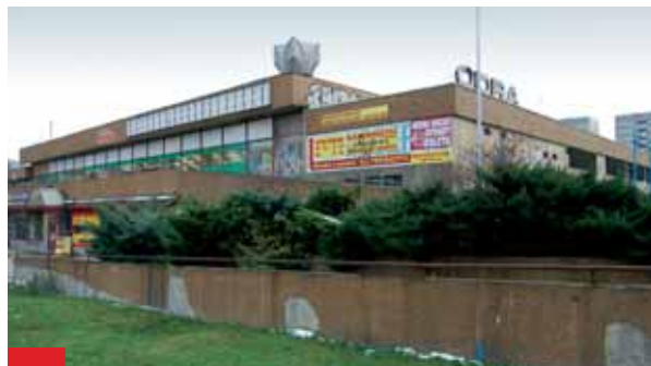
Současný stav objektu Odry vypadá dosti neutěšeně, do budoucna by se to však mělo změnit, jak napovídá vizualice v dolní polovině strany.

Občany nejvíce zajímá, jaké služby v novém objektu najdou. „Zachována zůstane prodejna potravin Hruška. Předběžně máme příslib od České pošty, České spořitelny a nově také od Komerční banky. Pokud i ostatní současní nájemci projeví zájem, mohou v objektu zůstat. Navíc přibudou další, protože odbytová plocha se zvětší,“ pokračoval. Občanům až do roku 2011 bude k dispozici i služebna městské