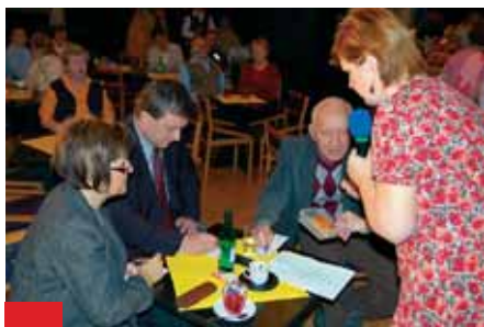
Porota měla přetěžkou úlohu vybrat z množství skvělých receptů ten nejlepší.