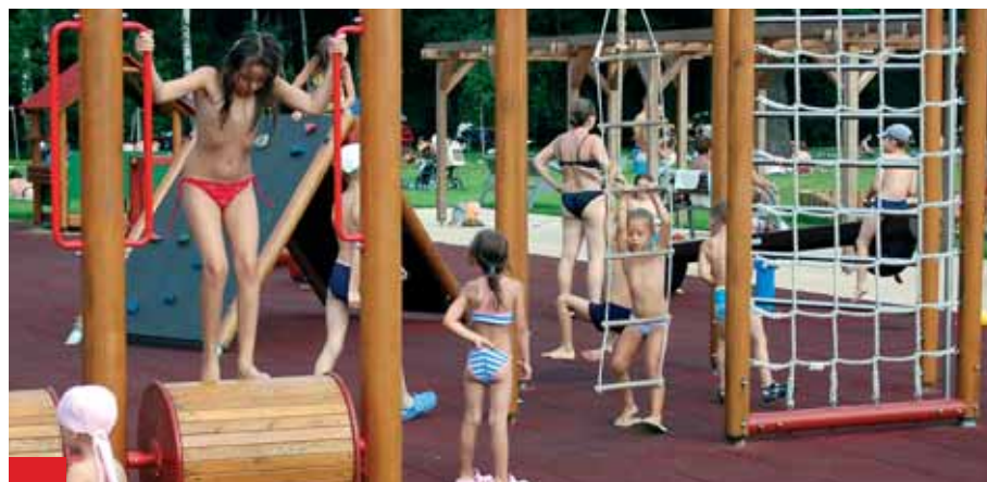
Zejména děti si letos při návštěvě Vodního areálu Jih užily mnoha nových atrakcí.

Do oprav škol jsme letos investovali téměř třicet milionů korun. Zbrusu nový kabát dostala třeba ZŠ Březinova, ZŠ Chruštinova má zase krásné hřiště. Navíc školám samotným se daří získávat finanční prostředky z evropských strukturálních fondů. Za významné považuji i to, že s pobočkou Ko-