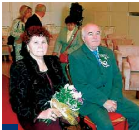
Manžele Wyhodovy oddal zastupitel Petr Opletal společně s ceremoniářkou Šárkou Zubkovou.