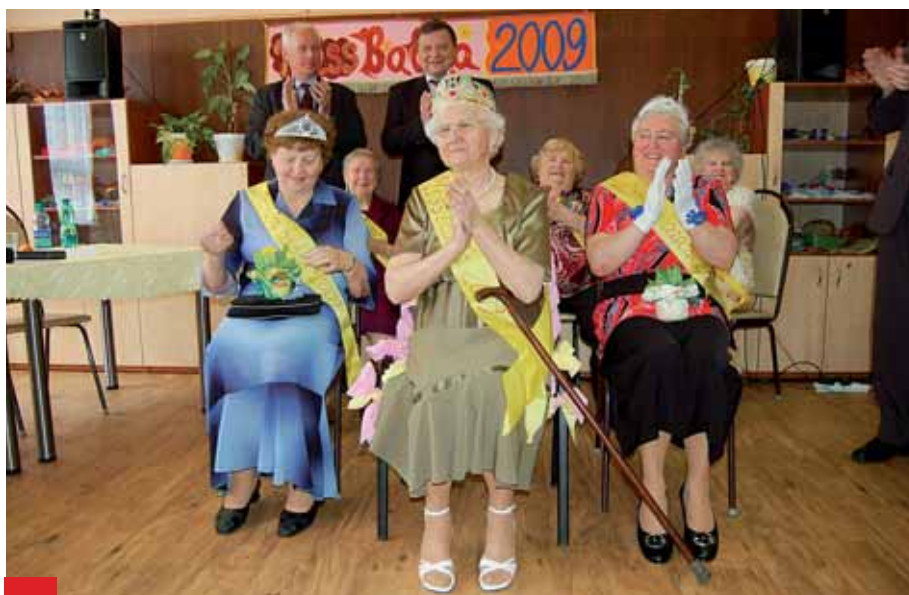
Všechny soutěžící přítomné diváky nadchly.

Už čtvrtý ročník celoměstské soutěže o titul Miss babča 2009 se poslední březnový den konal v zábřežském Domově pro seniory (DPS) Korýtko.