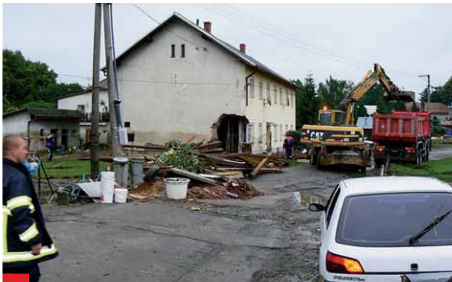
Na členy jednotky sboru dobrovolných hasičů čekala v Jeseníku nad Odrou spousta práce.

Naši dobrovolní hasiči pokračují dále do Jeseníku n. O. V důsledku doznívajících bouřky panují cestou špatné povětrnostní podmínky. Mnoho komunikací je zatopeno. Zhruba ve 23.20 hod. je JSDH konečně na místě v Jeseníku nad Odrou, nejhůře postižené obci. JSDH nafukuje člun a zahajuje záchranné práce. V tuto chvíli neteče obcí klidná říčka Luha, ale běsnící tok široký téměř půl kilometru a hluboký místy přes tři metry. Lidé zasažení povodní tak hledají útočiště na střeších, půdách, visí na okapech domů. V určeném úseku se podaří zachránit devět osob a dalších pětadvacet lidí je evakuováno a shromážděno ve vlastním voze, později v linkovém autobuse. Podchlazeným osobám je poskytnuta první pomoc a suché oblečení.