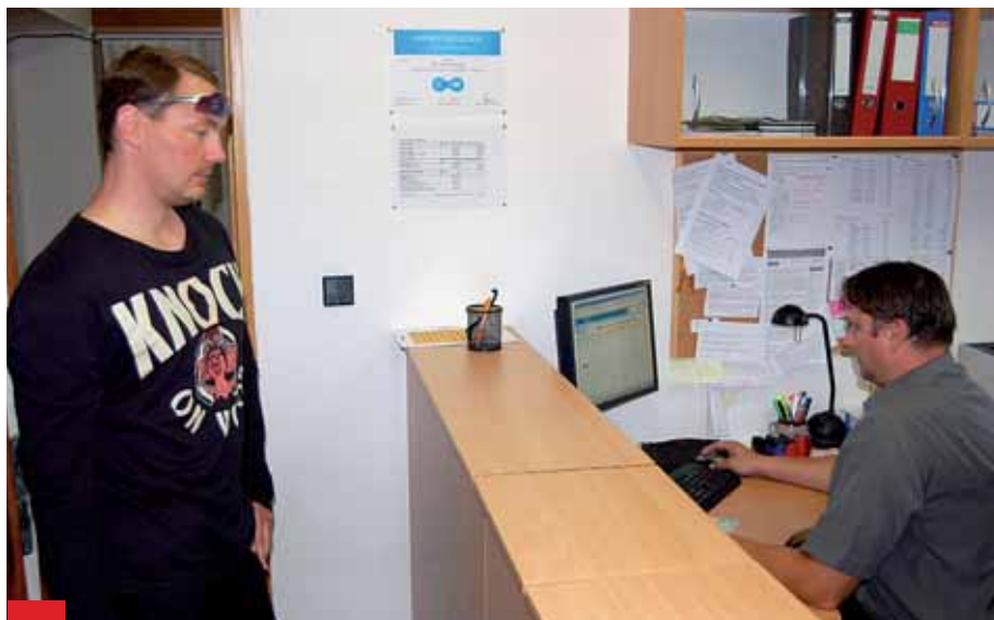
Občané si pochvalují zejména službu Czech POINT, která je na ÚMOB Ostrava-Jih hojně využívána.

Odbor vnitřních věcí Úřadu městského obvodu Ostrava-Jih pro občany zajišťuje mnoho potřebných a důležitých činností. Plní úkoly vyplývající jak ze samostatné, tak z přenesené působnosti statutárního města Ostravy.