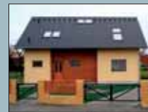
Vzorový dům OSTRAVA

Ol. Pod letištěm 20, 779 00 Olomouc-Neředín Kontakt: Ing. Libor Matějka Tel.: +420 585 416 440, Mob.: +420 724 003 247