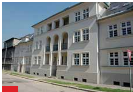
Nově zrekonstruované domy na Letecké ulici.

Ještě před pár lety zcela zanedbané domy rostou do krásy, z malometrážních bytů se stávají byty první kategorie s větší obytnou plochou. Jubilejní kolonie se postupně stá-