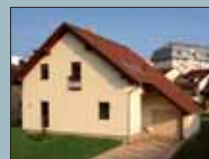
Vzorový dům OLOMOUC