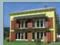
Vzorový dům BRNO

+ DOPRAVA ZDARMA POZOR! Časově omezená nabídka!