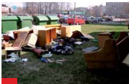
Tak to momentálně vypadá v sídlištní zástavbě na Dubině.

Hromady všemožného odpadu v kontejnerových stáních a neustále vznikající černé skládky. Taková je současná realita v lokalitě sídlištní zástavby na Dubině. To vše už by se brzy mělo stát minulostí, situaci by měl vyřešit sběrný dvůr, který by měl být umístěn na ulici Jana Maluchy.