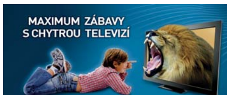
Chytrá televize – funkce, které usnadňují sledování TV. Pauza (pozastavení pořadu v jeho průběhu), Přetočení (pořadu na jeho začátek) a Nahrávání.

Optická síť umožňuje poskytovat rychlé a kvalitní připojení k Internetu i televizní služby v digitální kvalitě. Nájemníkům z domů, které jsou připojeny na optickou síť PODA, tak nabízí řešení příjmu TV signálů po vypnutí analogového tele-