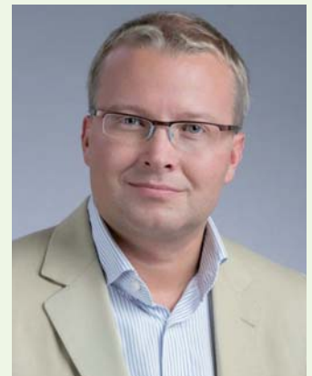
Ministr životního prostředí Tomáš Chalupa

Ministerstvo chce především přispět ke snížení emisí. Znečištěné ovzduší je samotnými obyvateli Moravskoslezského kraje ve výzkumech veřejného