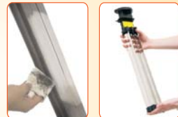
Filtry není třeba nikdy vyměňovat! Stačí je jen občas jednoduše vyjmout a otřít. Účinek filtrace ihned vidíte!