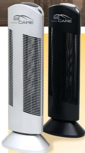
Ionic-CARE® Triton X6 Přístroj si můžete zvolit v černé nebo stříbrné variantě

Ostrov čistého vzduchu v moři smogu a škodlivin!