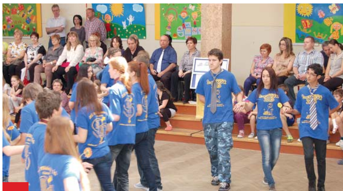
V ZŠ Mitušova 16 byl pro hosty připraven kulturní program.