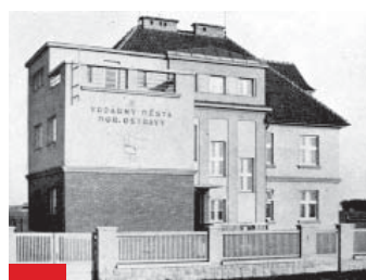
Budova velína na křižovatce Výškovické a Pavlovovy v roce 1935 a dnes.