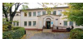
Centrum léčebné rehabilitace v Ostravě-Zábřehu.

Naše pracoviště má smlouvy se všemi zdravotními pojišťovnami, které také léčbu hradí.