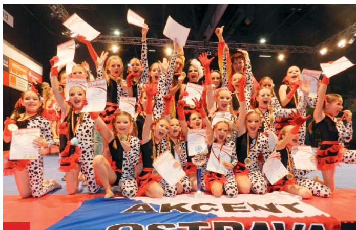
Slzičky štěstí, radosti a dojetí provázely vyhlášení MS dětských show dance formací. Mistrem světa se stala ostravská formace Salón Cruelly de Vil!

„Show dance je disciplína, která kromě výrazných a náročných tanečních kreač využívá efektivitu různých rekvizit, kulis, respektive působivých kostýmů. Důležité také je, aby skladba měla zajímavý příběh