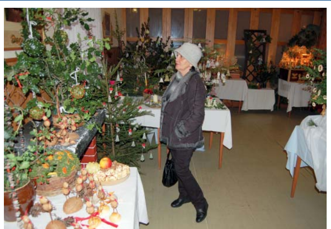
V salonku restaurace U Chýlků v Hrabůvce se koncem listopadu konala tradiční výstava Kouzlo Vánoc. Připravily ji ostravské zahrádkářky a návštěvníci mohli vidět ozdoby z přírodních materiálů i moderní vazby, adventní věnce nebo betlémy zhotovené z těsta, perníčky a další předměty, které se váží k období adventu.

o to, aby vymizelo parkování vozidel, které je v rozporu s příslušnými ustanoveními silničního zákona,“ dodal Planka. Celá studie je umístěna na webových stránkách obvodu při rozkliknutí odkazu www.ovajih.cz/doprava . Jedním z řešení parkování pro obyvatele je individuální výstavba parkovacích míst. Na uvedeném odkazu je také mapa, ze které se občané mohou dozvědět, zda právě v jejich okolí jsou k dispozici místa pro výstavbu stán. „Je možné, že některá místa mohla být opomenuta, o všem je možné jednat,“ uvedl místostarosta Planka. (kut)