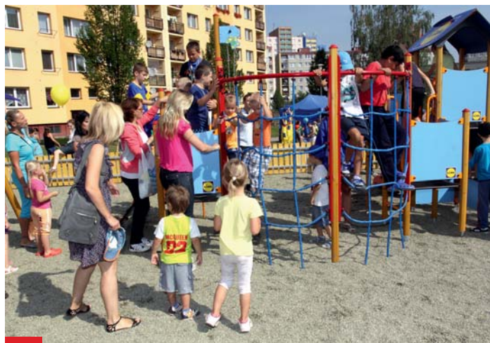
Jedno Rákosníčkově hřiště už v Ostravě-Jihu je, otevřeno bylo před necelými dvěma lety na Dubině.