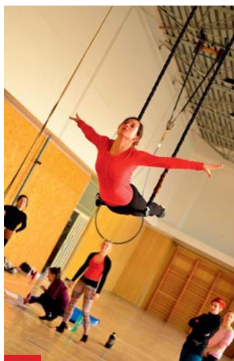
Workshop na hrazdě a v kruhu.

Cirkus trochu jinak zve všechny zájemce na oficiální otevření nového cirkusu v Ostravě nazvaného UmCirkum, které se uskuteční 5. a 6. dubna v bývalé ZŠ V Zálomu 1 v Ostravě-Zábřehu. V sobotním galavečeru od 17 hodin vystoupí přední česká novocirkusová uskupení, jako jsou Cink Cink Cirk (Praha), Cirkus Levitare (Olomouc), Žonglér o. s. (Plzeň), ale také ostravský Cirkus trochu jinak. Umělci předvedou své nejlepší artistické kusky, kde fantazie nezná hranic a vše, co se zdá být iluze a sen, je skutečné! O den později od 9 do 17 hodin jsou připraveny workshopy vzdušné akrobacie (na šále, hrazdě a v kruhu), párové akrobacie, provazochodectví, žonglování, hula hoop a chybět nebudou ani balanční disciplíny – walking ball, rola bola a také novinka cyrwheel.