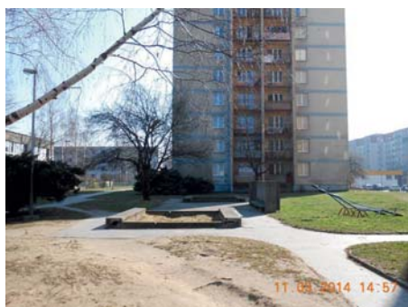
V této lokalitě nedaleko prodejny Lidl na Jugoslávské ulici v Zábřehu by mělo vzniknout další Rákosníčkově hřiště.

jich do konce roku bylo po celé České republice celkem padesát.