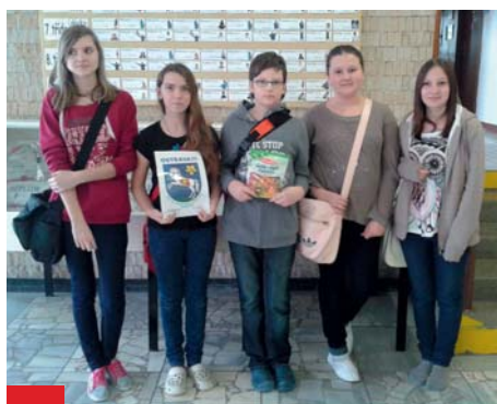
Družstvo 7.B ZŠ Mitušova 8, které skončilo na 3. místě.

Žáci celý den soutěžili a pracovali v týmech. Námětem soutěží, které vyučující pro žáky připravili, byly historické památky, významné osobnosti z oblasti sportu, literatury, divadla a hudby, ostravská sportoviště, historie i současnost zoologické zahrady. Inspirací byl také populární Ostravak ostravski nebo obvod-