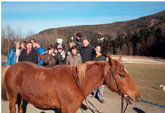
JÍZDÁRNA. Rodiče a děti z Čmeláčku vyrazili loni do jízdárny.