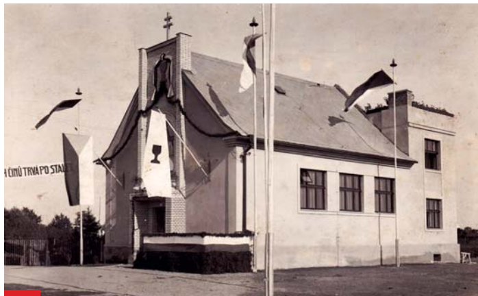
Husův sbor v roce 1934 a v dnešní podobě.

Nedaleko hasičské záchranné stanice na Hasičské ulici v Hrabůvce se nachází nevelký Husův sbor Církve československé husitské, který byl poprvé otevřen věřícím před 80 lety v roce 1934.