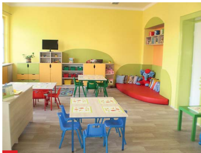
Nová je také třída Ježek v MŠ U Zámku.

V MŠ B. Dvorského díky finančnímu krytí zřizovatele proběhla výměna všech oken a vstupních dveří, vyzdívání meziokenních vložek a celá budova školky byla vymalována. Velké investice má za sebou MŠ Mitušova 90, v celém objektu byla vyměněna okna, ve všech třídách je nové linoleum a děti se těší z nového nábytku. Výměnu oken v jednom pavilonu má za sebou i MŠ Mjr. Nováka, kde byly instalovány vnitřní parapety a kryty topení ve třídách. Z prostředků Magistrátu města Ostravy probíhají revitalizace budov MŠ A. Kučery, MŠ P. Lumumby a MŠ Za Školou.