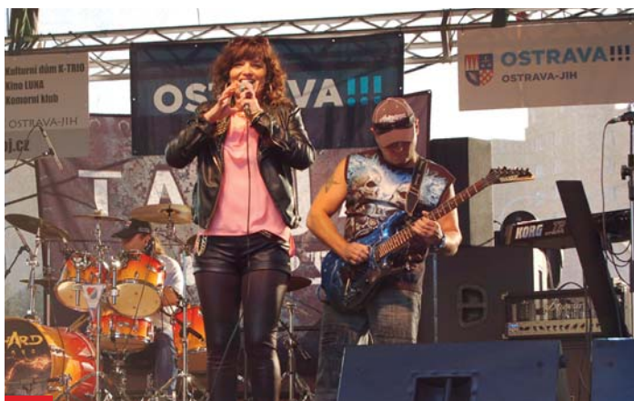
Publikum rozparádila populární zpěvačka Tanja.