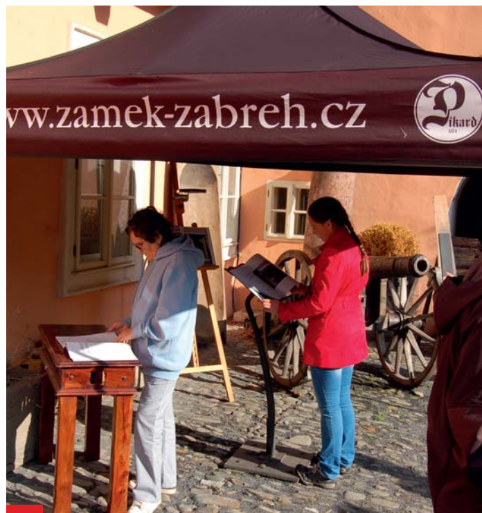
Zájemci mohli nahlédnout do nové publikace Zámek Zábřeh.