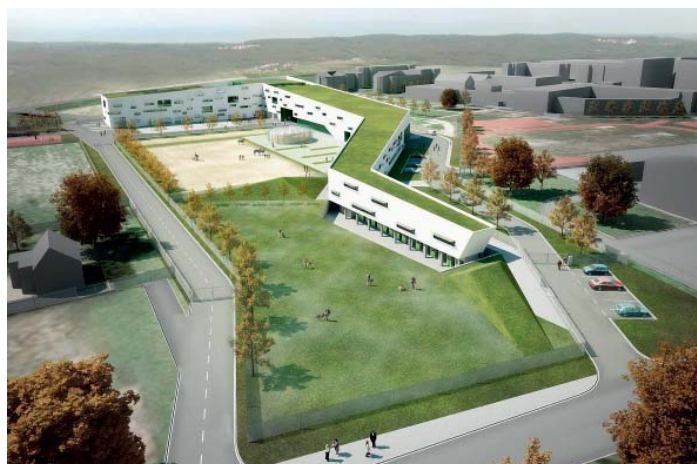
vizualizace: PROJEKTSTUDIO EUCZ, s. r. o.

Centrum vznikne mezi ulicemi Fr. Formana a Kaminského v městském obvodu Ostrava-Jih. Půjde o novostavbu třípodlažního objektu s pravoúhlým půdorysem ve tvaru