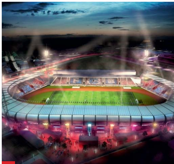
Vizualizace finální fáze stadionu