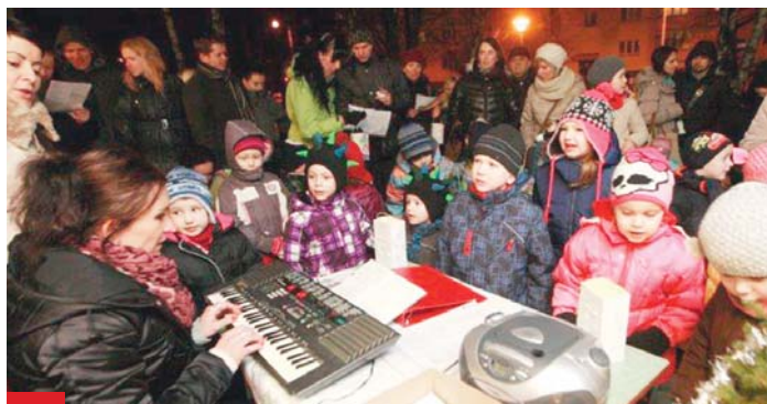
Zpívání vánočních koled před MŠ Klegova v Hrabůvce.

„Tradice si zaslouží, aby je lidé dodržovali a dále prohlubovali. Proto se naše školka přidala ke zpívání koled. A moc se to dětem povedlo,“ svěřila se před rokem po prvním společném