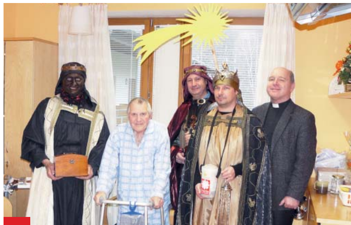
Tři králové zavítali také do Hospice sv. Lukáše ve Výškovcích.