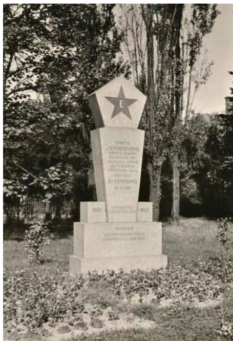
Památník v Rottrově sadu na dobové pohlednici

Myšlenka na založení esperantského spolku vznikla během pravidelného setkávání skupinky esperantistů, z nichž většina pocházela z Jubilejní kolonie nebo nedaleké vilové čtvrti. Prvotním impulzem bylo rozhodnutí začít pořádat kurzy esperanta, které by pomohly získat nové zájemce o studium. Na podzim roku 1946 bylo proto na jedné ze schůzek v Eliášově hostinci rozhodnuto, že příští rok bude zahájena výuka esperanta a zároveň bude založen spolek, který bude zajišťovat spojení s dalšími kluby v Československu a zahraničí. První slavnostní setkání členů spolku proběhlo 28. března 1947 v den výročí narození Jana Amose Komen-