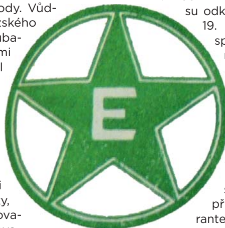
Zelená hvězda je základním symbolem esperanta