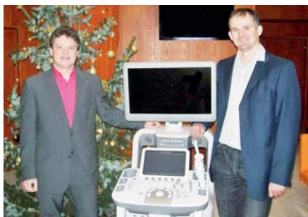
Klinika Silesia Medical si nový přístroj nadělila pod stromeček.

„S pomocí tohoto přístroje mohou nastávající rodiče poprvé spatřit tvář svého dítěte. Na speciálním velkoplošném monitoru je možné detailně sledovat mimiku obličeje, pohyby končetin nebo srdeční činnost. 4D ultrazvuk dokáže zachytit onemocnění i vývojové