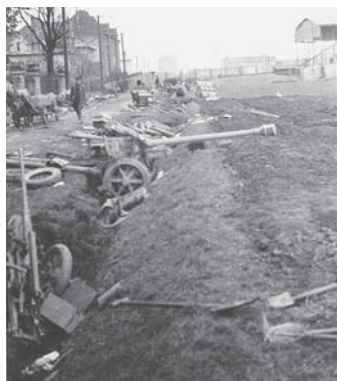
Zbytky německých pozic po bojích v Zábřehu.

Vyvrcholí 30. dubna, kdy se po celý den uskuteční spousta zajímavých akcí.