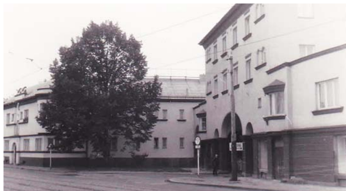
Lípa svobody kdysi stávala v Jubilejní kolonii v Hrabůvce.

Myslím, že každoročně najdeme i jiné způsoby, jak si osvobození připomenout. Nyní se opravdu jedná o výjimečnou akci, která obnoví tradici již zmíněné lípy u Jubilejní kolonie. (kut)