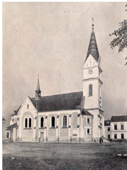
Kostel po dokončení v roce 1910.