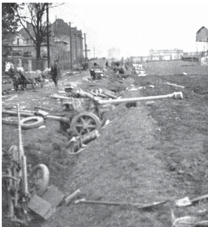
Hulvácká ulice v Zábřehu po bojích.