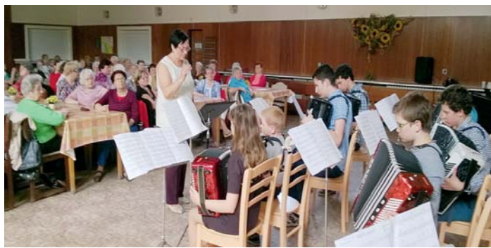
Květnový koncert ke Dni matek.

svůj čas. Společně navštěvují divadelní představení, hrají společenské hry, jsou pro ně připravovány různé besedy na zajímavá témata z oblasti bezpečnosti seniorů, péče o zdraví, ale také např. o životě v ostravské zoo. Pod vedením kvalifikovaných pracovníků domova Čujkovova trénují paměť. Pro zlepšení fyzické kondice chodí společně na vycházky, prostřednictvím zájezdů poznávají zajímavá místa. Na měsíc září pak odbor sociální péče připravuje pro seniory osmý ročník sportovních her Víno-Hraní. Každoročně se při příležitosti Mezinárodního dne seniorů koná setkání s představiteli obvodu, kde je připraven bohatý program včetně tance. Díky velmi dobré spolupráci s Divadlem U Lípy mají senioři možnost každý