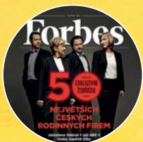
TITULKA ČASOPISU FORBES CZ KVĚTEN 2014