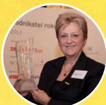
EY PODNIKATEL ROKU PRAHA A STŘEDOČESKÝ KRAJ 2013 - 1. MÍSTO