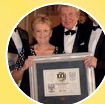
ČESKÝCH 100 NEJLEPŠÍCH FIREM 2014 - 7. MÍSTO