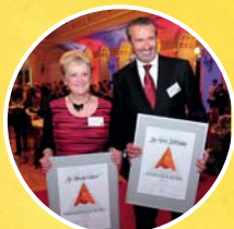
MANAŽERKA ROKU 2013 - 1. MÍSTO