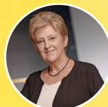
TOP 25 ŽEN ČESKÉHO BYZNYSU 2014 - 3. MÍSTO