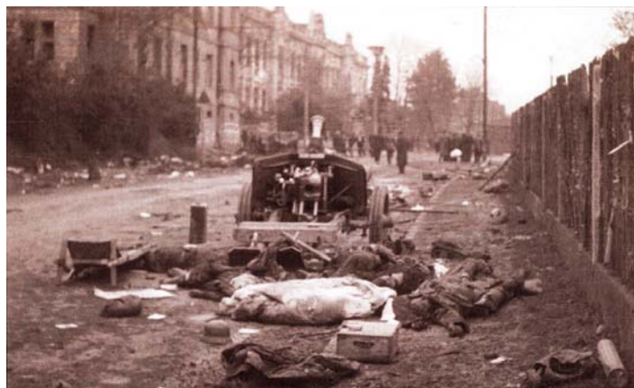
Křižovatka ulice Dolní a Hulvácká v Zábřehu.

Útok na Zábřeh byl zahájen následujícího dne za úsvitu. Po dělostřelecké přípravě začaly od Odry postupovat sovětské jednotky poli kolem zábřežského hřbitova k centru obce, které dosáhly v poledne poté, co německé oddíly ustoupily do Hulvák. Brod U Korýtky ráno překonali také českoslovenští tankisté, kteří měli podporovat postup sovětských oddílů k Moravské Ostravě. Pro přesun k Moravské Ostravě využili vojáci úvoz, kterým dnes prochází tzv. Polanecká spojka. Tanky, které se pohybovaly souběžně s pochodou po obou stranách