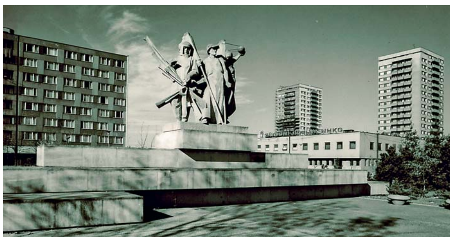
datum: přelom 70./80. let 20. století

V únoru 1972 se práce na pomníku pozastavily. A právě v tomto roce se na scéně kolem pomníku objevuje postava brněnského sochaře Miloše Axmana, a to jako odborného poradce. Axman byl žákem Vincence Makovského, což je významné i v souvislosti s konečnou podobou pomníku v Ostravě-Hrabůvce. Později vedl po svém učiteli ateliér na Fakultě architektury VUT v Brně, od 1973 byl v čele sochařského ateliéru na pražské Akade-