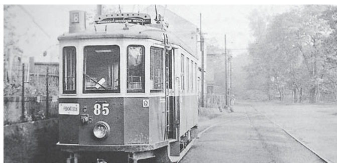
Zábřeh nad Odrou v zrcadle starých fotografií

Zábřežské kostely, kříže, kapličky, řeka Odra, tramvajová dráha a nehody, průmysl, Polanecká spojka, usedlosti na bývalé Horymírově ulici, procházka ulicemi na místě dnešní Sport arény – to jsou jen některé okruhy snímků, které budou doplněny výkladem.