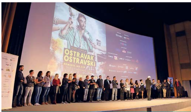
Slavnostní premiéra filmu OSTRÁVAK OSTRAVSKI proběhla 11. 10. v kině Luna, které je 3. nejnavštěvovanějším jednosálovým kinem v ČR.

V tomto čísle jsme pro vás opět připravili tajenku skrývající druhé slovo z názvu sportovní události. Pět nejrychleji zaslanych e-mailů se správnou tajenkou a pět prvních dopisů odměníme dárkovými balíčky a lístky do kina Luna. Tajenku zašlete na e-mail: soutez@ovajih.cz nebo s označením TAJENKA na Úřad městského obvodu Ostrava-Jih, Horní 791/3, 700 30 Ostrava-Jih.