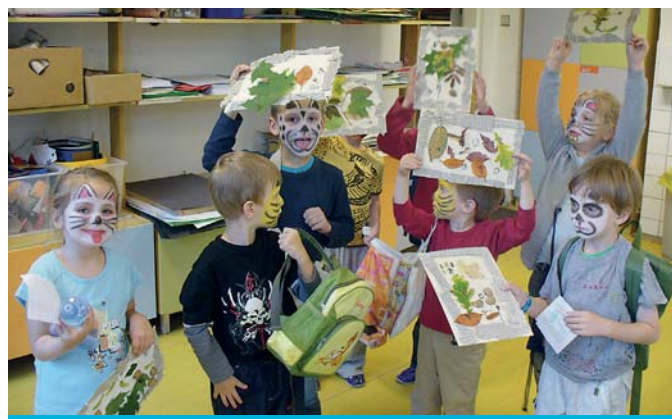
Výtvarná dílnička Barvínek je určena dětem předškolního věku. K náplni volného času neodmyslitelně patří sportovní vyžití.

K akcím nejvíce oblíbeným u široké veřejnosti se řadí přehlídky zájmových činností, festival Bavíme celou rodinu a taneční soutěž Paforta, ekologický Den Země, sportovně-humanitární Běh naděje, sportovní turnaje, karnevaly, dětské dny a další. Nechybí ani „akce na klíč“ pořádané pro jiné subjekty.