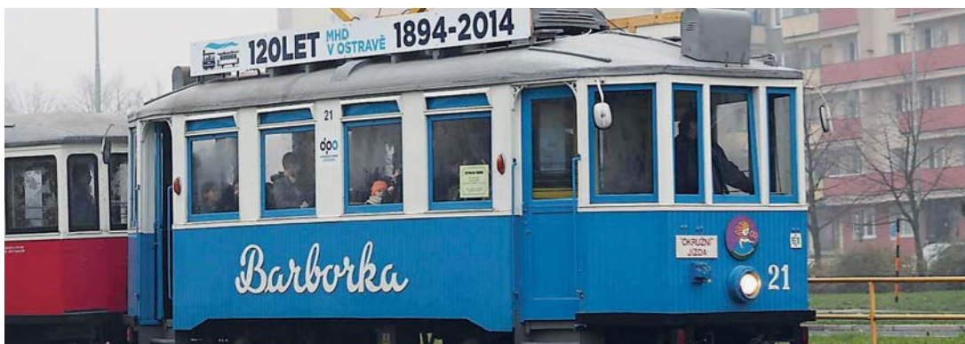
Legendární Barborku znají všechny generace

Legendární ostravská tramvaj Barborka bude 11. 11. 2016 těšit malé i velké cestující na tramvajové trase č. 15. Vyjždět budeme ze směru Dubina v době od 15:30 do cca 18:30 hod.