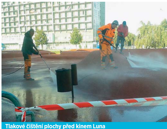
Tlakové čištění plochy před kinem Luna

V souvislosti s Památkou zesnulých jsme uklízeli hřbitov na ulici U Studia. Padající listí se odtud odstraňuje permanentně. Stále pokračují ořezy keřů, a to nejen tam, kde zasahovaly do chodníků a znemožňovaly dobrý výhled řidičům. Kácíme suché stromy, odstraňujeme i jednotlivé suché větve.