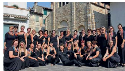
Ženský sbor z jihu Ostravy zvítězil v září na jihu Evropy. Soutěž probíhala v prostorách nádherné historické baziliky v centru přímořského města Grado.