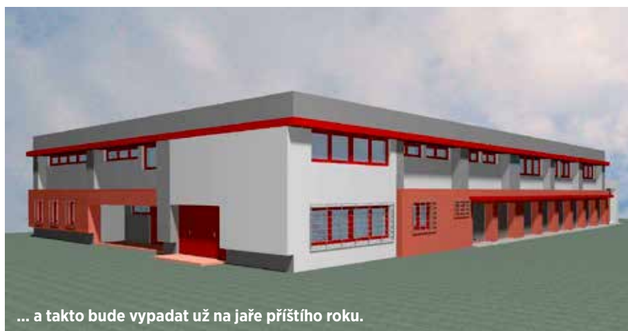
... a takto bude vypadat už na jaře příštího roku.