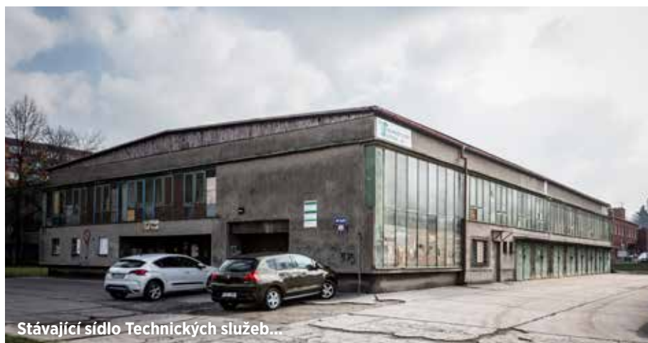
Stávající sídlo Technických služeb...