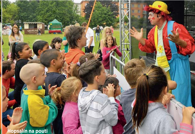
Hopsalín na pouťi