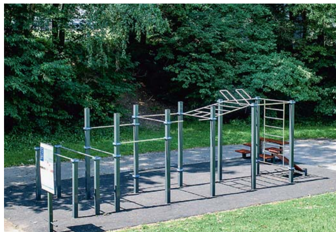
Workout hřiště Lumírova