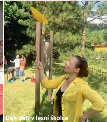
Den dětí v lesní školce