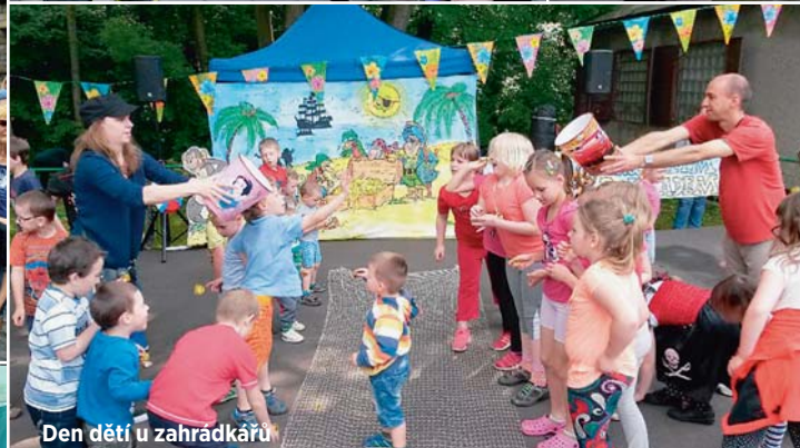
Den dětí u zahrádkářů