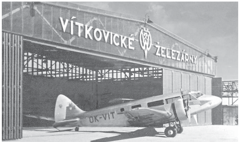
Soukromý letoun Vítkovických železáren v 2. polovině 30. let