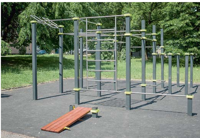
Workout hřiště Průkopnická