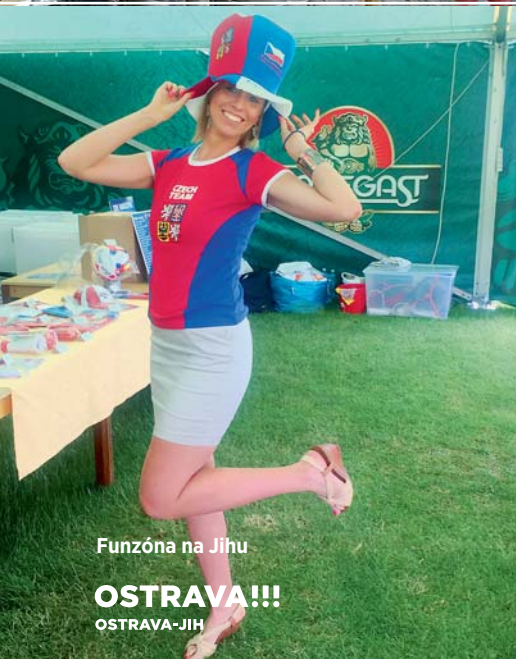
Funzóna na Jihu