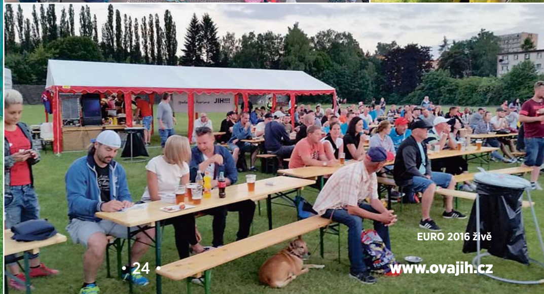
EURO 2016 živě