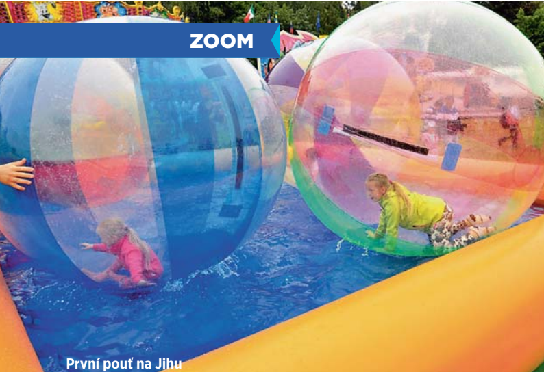
První pouť na Jihu