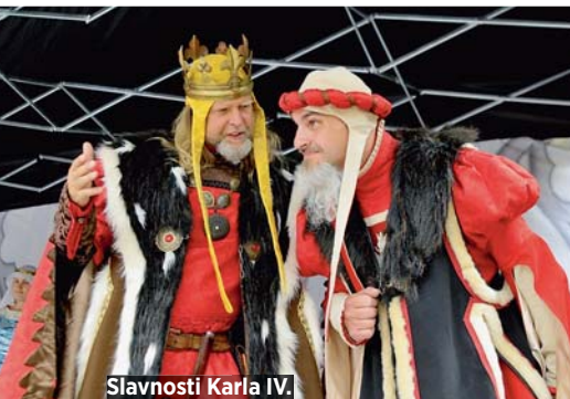
Slavnosti Karla IV.

sezónu, ale také akce pořádané na blízkém bývalém fotbalovém hřišti, tedy vůbec první pouť na Jihu a večery věnované fotbalovému fandění. Karel IV. se svou družinou pak dali v prostředí zábřežského záměčku důstojnou tečku za několikadenní výstavou gotického zvonu opředeného legendami. Na jakou akci z našeho diáře se chystáte v létě vy?