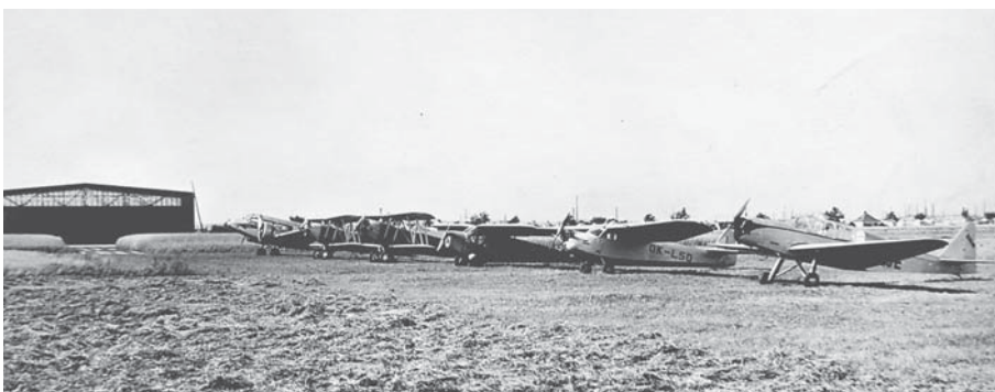
Letadla na letištní ploše v 2. polovině 30. let