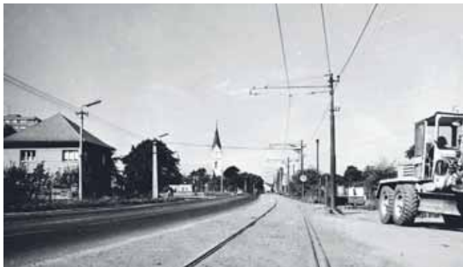
Stará Míšecká ulice v Hrabůvce s tramvajovou tratí na počátku 70. let

Rozvoj průmyslu a příslib práce lákal na Ostravsko po druhé světové válce množství nových obyvatel, pro které se Ostrava stala druhým domovem. Podle plánů z počátku 60. let měla být nejrozsáhlejší bytová výstavba realizována na jižním okraji města v prostoru bývalého letiště v Hrabůvce a přilehlých obcí Zábřeh, Výškovice, Hrabová, Stará a Nová Bělá. Podle předpokladů zde mělo žít až 220 000 obyvatel a nově budované sídliště označované jako Jižní Město se tak mělo stát největším v Československu.