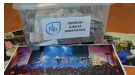
Díky štědrosti návštěvníků plesu jsme pomohli nemocným.