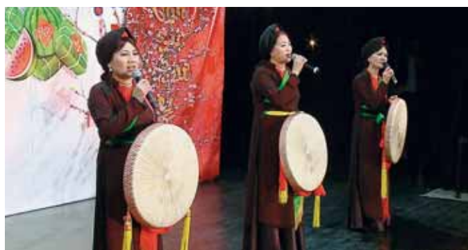
Akcí doprovodil tradičně bohatý kulturní program

„Jsou velmi upřímní a je vidět, že dodržují tradice, které předávají mladší generaci. Asi bychom si z nich měli vzít v tomto směru příklad,“ řekla místostarostka. (mars ve spolupráci s TV Polar)