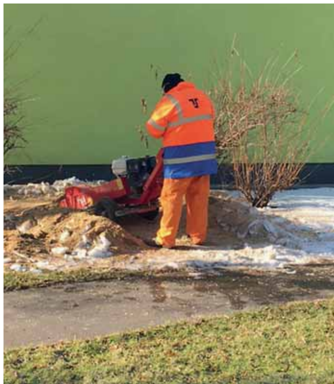
Pracovníci technických služeb nezahálejí. Momentálně dělají ořezy stromů a keřů.