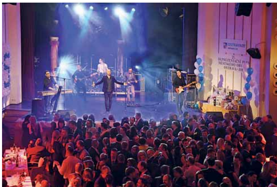
Slovenská kapela No Name naplnila hlavní sál k prasknutí.