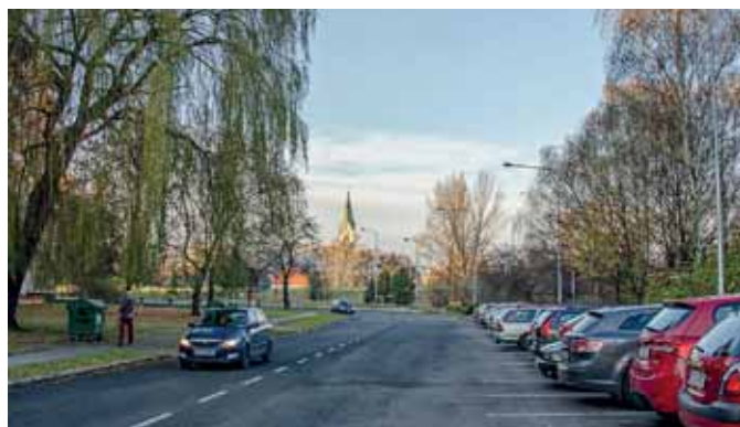
Pohled ze stejného místa - dnešní ulice Aviatikův v Hrabůvce