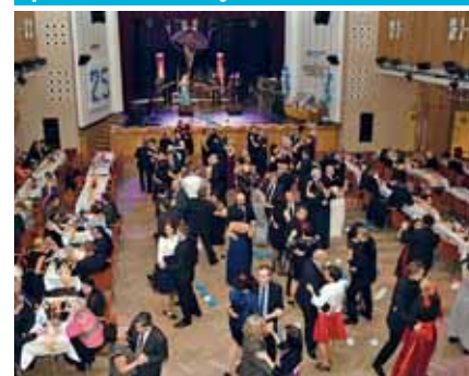
K tanci hrála skupina Jupiter.