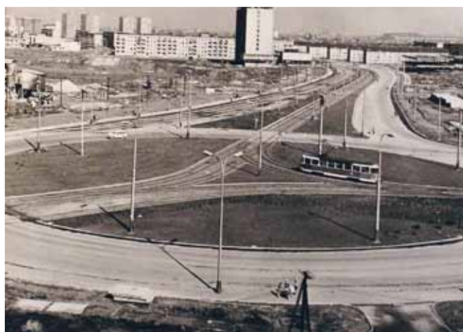
Kruhový objezd na ulici Horní a Dr. Martíňka na počátku 70. let