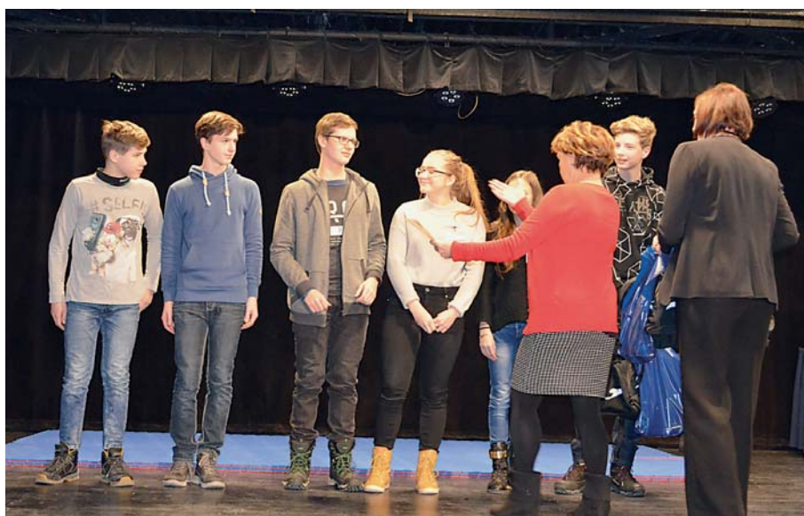
Vyhlášení soutěže Řemeslo má zlaté dno, která proběhla ve dnech 18.-19. ledna v Kulturním domě K-TRIO