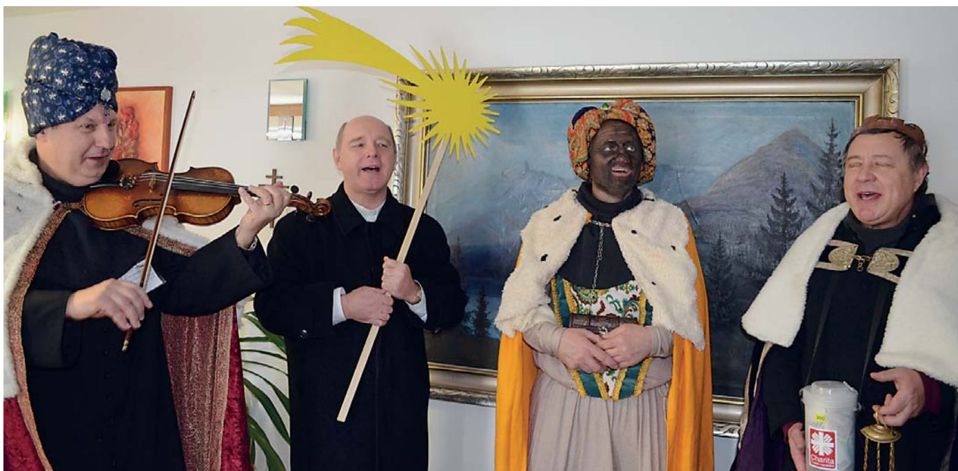
V rámci Tříkrálové sbírky navštívili radnici 6. ledna Tři králové