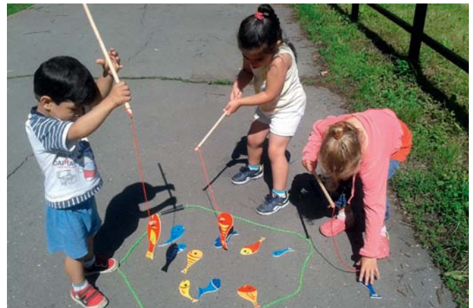
Rodinné centrum nabízí dětem řadu aktivit

V roce 2017 plánujeme projekt spolupráce „Červený, bílý, modrý: dialog polsko-český (Czerwony, biały, niebieski: dialog polsko-cze-