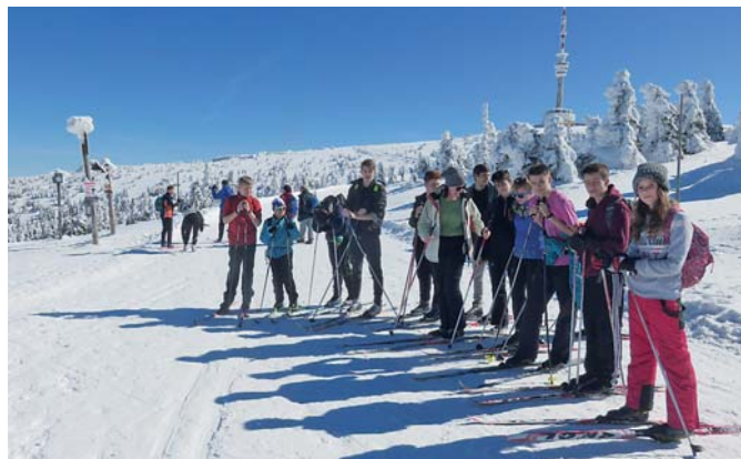
Čistý vzduch, krásná příroda a slunečné počasí provázely děti na každém kroku

V loňském školním roce se ozdravného pobytu, který se konal v Karlově pod Pradědem, účastnilo 90 dětí ZŠ B. Dvorského a celá akce sklídila velký úspěch. Žáci se v rámci pobytu věnovali sjezdovému a běžeckému lyžování, turistice, plavání, a dokonce se zúčastnili závodů v rámci projektu S ČT NA VRCHOL. „Věříme,