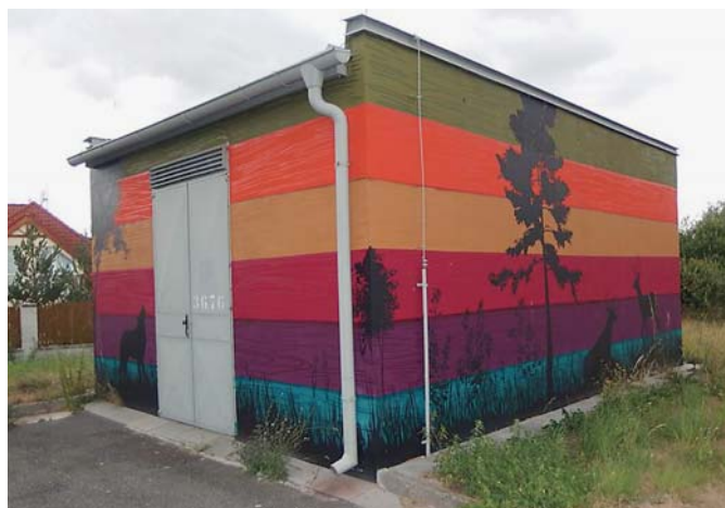
Jak to dělají jinde - v rámci projektu Společně pro Zbraslav získalo pestrobarevnou fasádu několik trafostanic ve městě

Participativní rozpočet se v posledních třech letech ukázal být „nebezpečně nakažlivým“. V hlavním městě už pronikl do městských částí Praha 3, Praha 6, Praha 7, Praha 8, Praha 10, Zbraslav a šířil se i do okolí: Říčany u Prahy, Mnichovice, Dobřejovice.