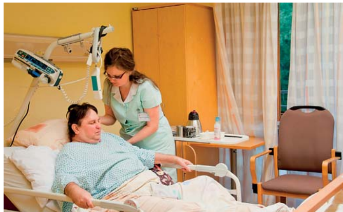
Hospic sv. Lukáše

Azylový dům pro matky s dětmi sv. Zdislavy na Kapitolní ul. poskytuje zázemí až 9 matkám a 15 dětem, které se ocitly v ži-