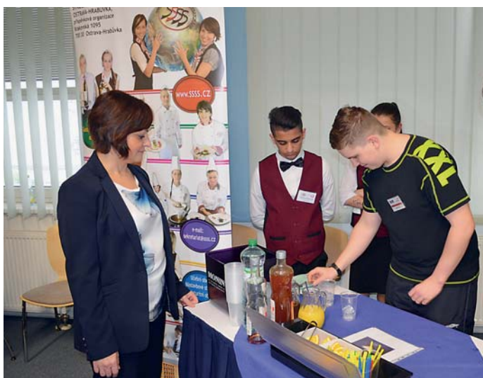
Studenti předvedli své dovednosti na soutěži Řemeslo má zlaté dno