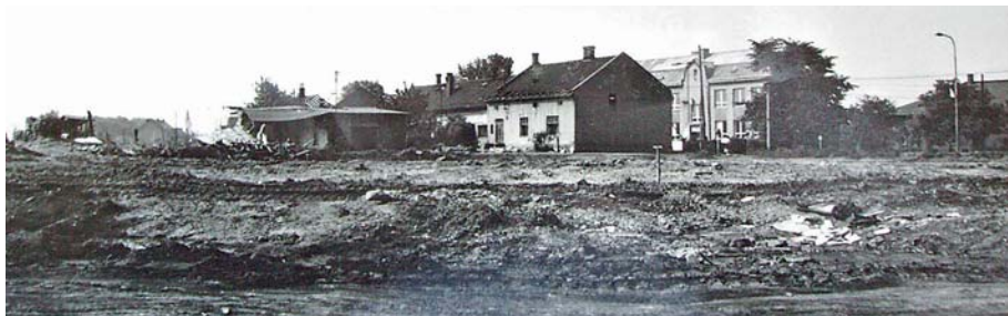
Demolice budov u Cholevova gruntu s budovou školy v pozadí z důvodu výstavby Nové Místecké (počátek 70. let)