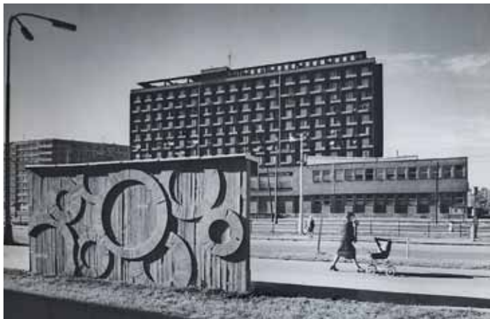
FOTOGRAFIE Petra Sikuly zobrazující dnes již zaniklou plakátovací zeď vytvořenou podle návrhu M. Rybičky v blízkosti HD Hlubina, 80. léta 20. století.

staví nový dům. Dříve za komunistů se takhle nestavělo, nebyly peníze.