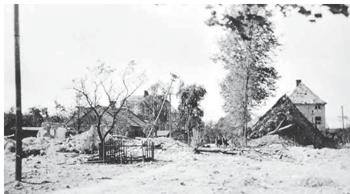
OBČANSKÁ zástavba po náletu.

Tříštivá puma dopadla i do blízkosti farní budovy na ulici Závofí. Farní kronika událost popisuje