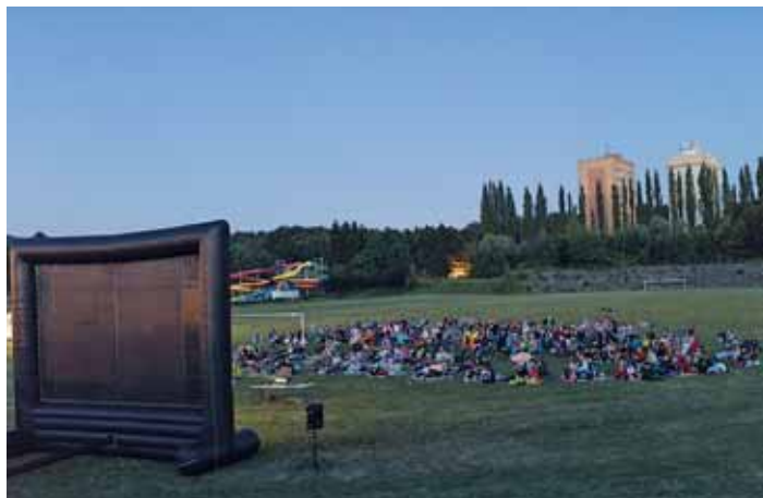
I PŘES CHLADNÉ POČASÍ se na posledním promítání diváci bavili.

Zveme vás a vaše děti na poslední promítání letního kina v tomto roce, které se bude konat v Lesní školce v Bělském lese. 24. 8. od 20:30 se můžete podívat na film Alenka v říši divů: Za zrcadlem! A jelikož se jedná o letní kino pro děti, bude pro ně už od 17:00 hodin v areálu připraven zábavný program. Těšit se mohou na skákací atrakce, malování na obličej a další. Nezapomeňte přijít!