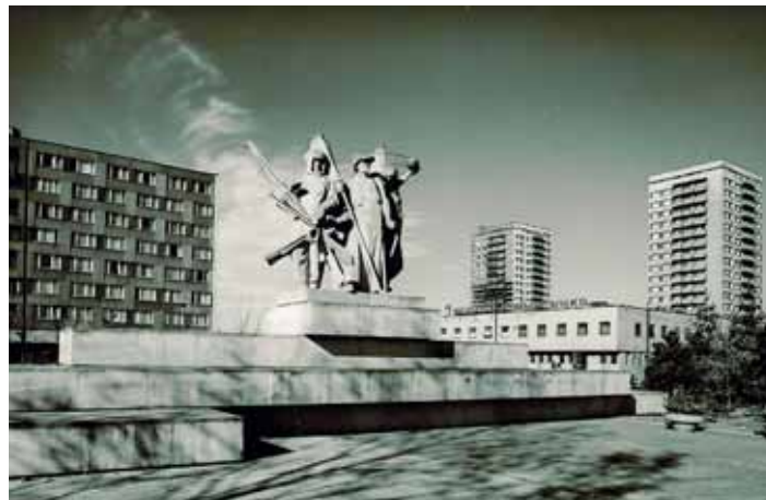
PAMÁTNÍK budování socialismu u Plzeňské ulice, z přelomu 70. a 80. let minulého století.

Nedávno jsem si udělal aparát s dírkovou komorou a chystám se s ním začít fotografovat. Ale není tam jedna dírka (jak obvykle bývá), ale já jich tam mám asi pět a ještě s nimi můžu otáčet. Záběry se přes ty dírky budou překrývat, takže to bude taková zajímavá kompozice toho snímku.