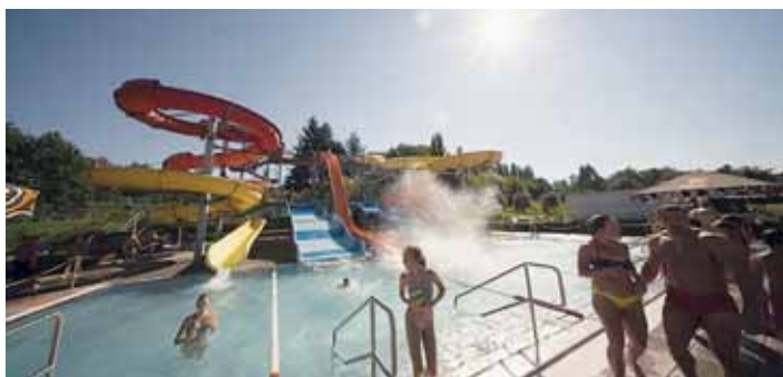
VODNÍ AREÁL Jih, ul. Svazácká, Ostrava - Zábřeh.

Úžasnou atmosféru koupaliště s několika druhy bazénů pro plavce i neplavce dotváří 16m dlouhé skluzavky, 20m strmá skluzavka „kamikadze“ a 86m dlouhé tobogány. Jedinečná stavba tohoto skluzavkového ráje je dominantou celého koupaliště, kterou jen tak nepřehlédnete. Pro plavce je tady 50m bazén. Má hloubku 140–180cm a k dispozici je 6 plaveckých drah. Kolem bazénu jsou rozmístěna lehátka, které můžete využít na opalování a odpočinek.