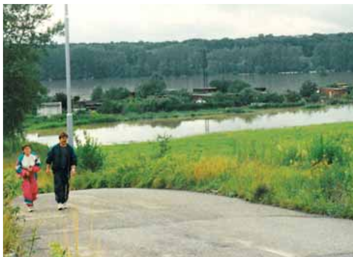
Pohled na zatopenou část starých Výškovic během povodní v roce 1997.