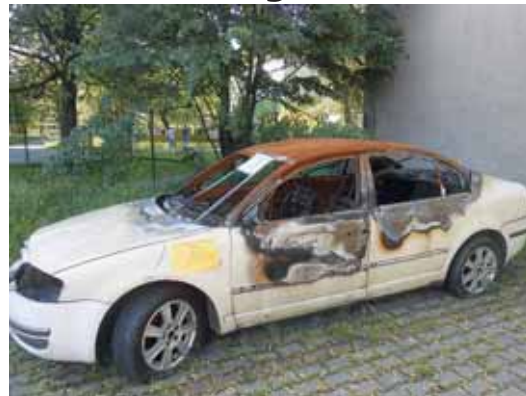
Stav dlouhodobě odstavených vozidel a autovraků k 21. 7. 2017