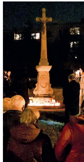
AKCE „PRŮVOD SVĚTEL“ má dlouholetou tradici a vždy velkou účast.