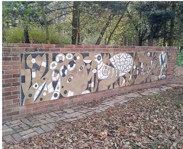
DEKORAČNÍ STĚNA v Bělském lese