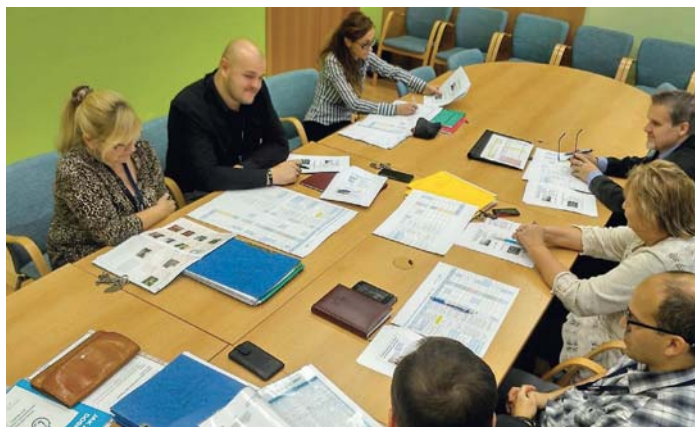
Zástupci příslušných odborů projednávají na schůzce jednotlivé návrhy

Na dětském hřišti na ulici Lumírova ve Výškovicích přibude chodník mezi atrakcemi, který zpríjemní pobyt na hřišti, když je blátivo, a poblíž ulice Šeříkova si děti budou moci užívat travnatou plochu k míčovým hrám, ale s povrchem zbaveným nerovností a s opravenými brankami, se zábranou proti padání míčů