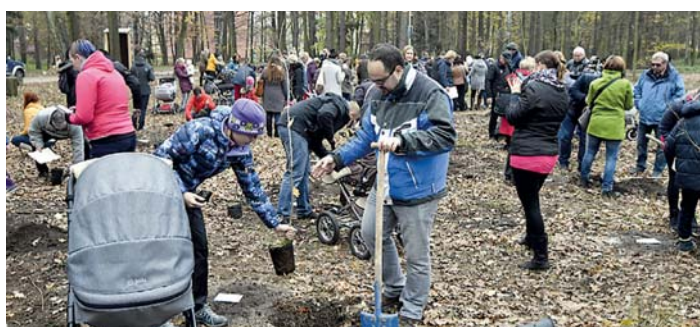
SADY MLADÝCH se uskutečnily již po čtvrté a budí stále větší zájem, tentokrát bylo pro děti vysazeno 41 stromků.