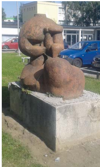
SOCHA Matky s dítětem

informační tabulkou s textem. Jih má ve svém veřejném prostoru řadu soch, ne všechny jsou ale v dobrém stavu. V opravách proto plánuje pokračovat i v následujících letech.