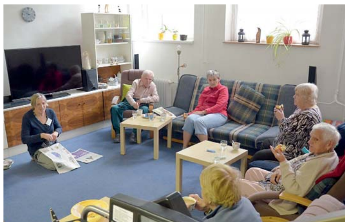
PROGRAM v Denním centru Charity

Charita Ostrava v rámci aktivit Charitní hospicové poradny a Mobilního hospice sv. Kryštofa nabízí možnost bezplatné účasti na semináři „Jak pečovat o nemocného