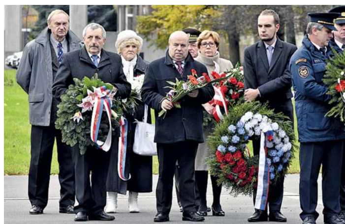
U PŘÍLEŽITOSTI DNE VÁLČNÝCH VETERÁNŮ položili u Památníku Rudé armády věnce a květiny zástupci státních a samosprávných orgánů i ozbrojených složek.