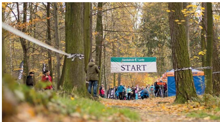
START 3. ročníku závodu Starobělské Lurdy

■ V neděli 12. 11. proběhl už 3. ročník běžeckého závodu Starobělské Lurdy. Hlavní závod odstartoval úderem 11. hodiny. Na trať dlouhou 3,2 km se předem zaregistrovalo přes 1300 běžců. Jejich počet tak stále roste.