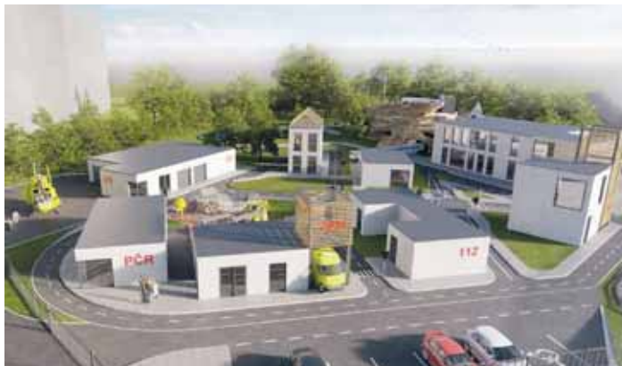
TAK BY MĚLO vypadat Městečko bezpečí.

Po Karlových Varech to bude druhé podobné zařízení v České republice. (sed)