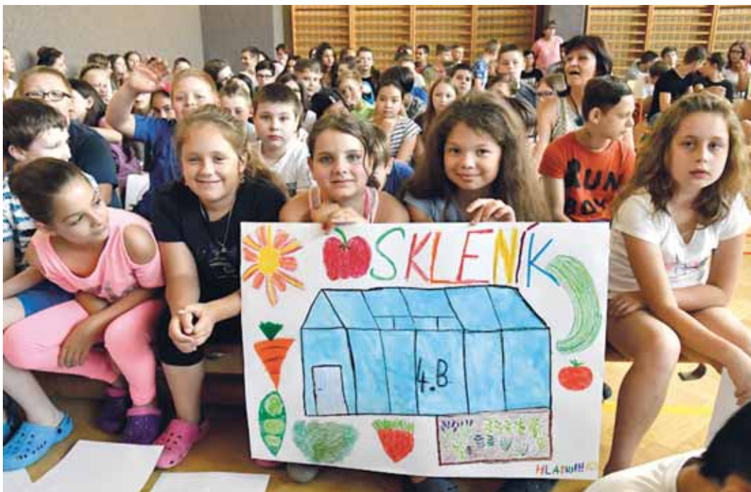
LETOS POPRVÉ se mohli do participativního rozpočtu zapojit také žáci základních škol. Školáci ze ZŠ Horymírova podali návrhů dokonce 10. Jedním z nich byl i skleník. Více čtete na straně 6.

Všechny informace naleznou zájemci na www.spolecnetvorimejih.cz , aktuální dění lze sledovat na facebook.com/spolecnetvorimejih . (gg)