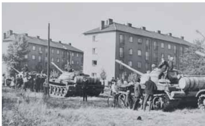
TANKY v blízkosti náměstí SNP 21. srpna 1968.

Příchod okupantů do města vyvolal rozsáhlou vlnu odporu. V ulicích se objevovaly nápisy, letáky, plakáty a výzvy odsuzující okupaci. U Nové radnice, NHKG,