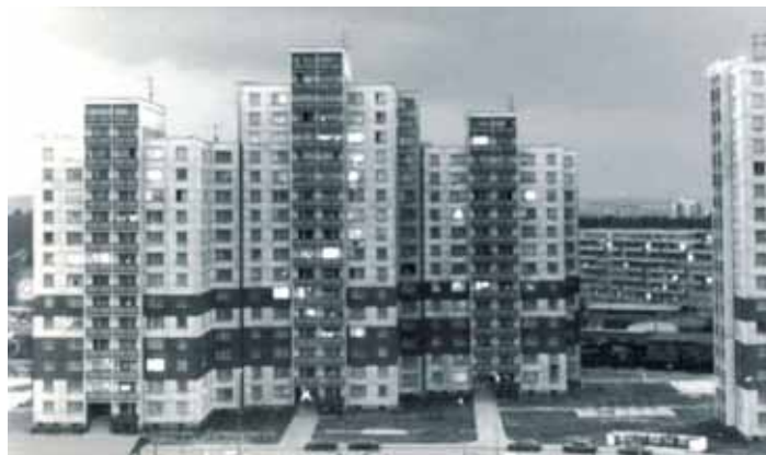
TROJICE spojených VP-OS na historické fotografii z Bělského Lesa.

Značně rozšířenou verzi tohoto článku naleznete na webové stránce historie.ovajih.cz.