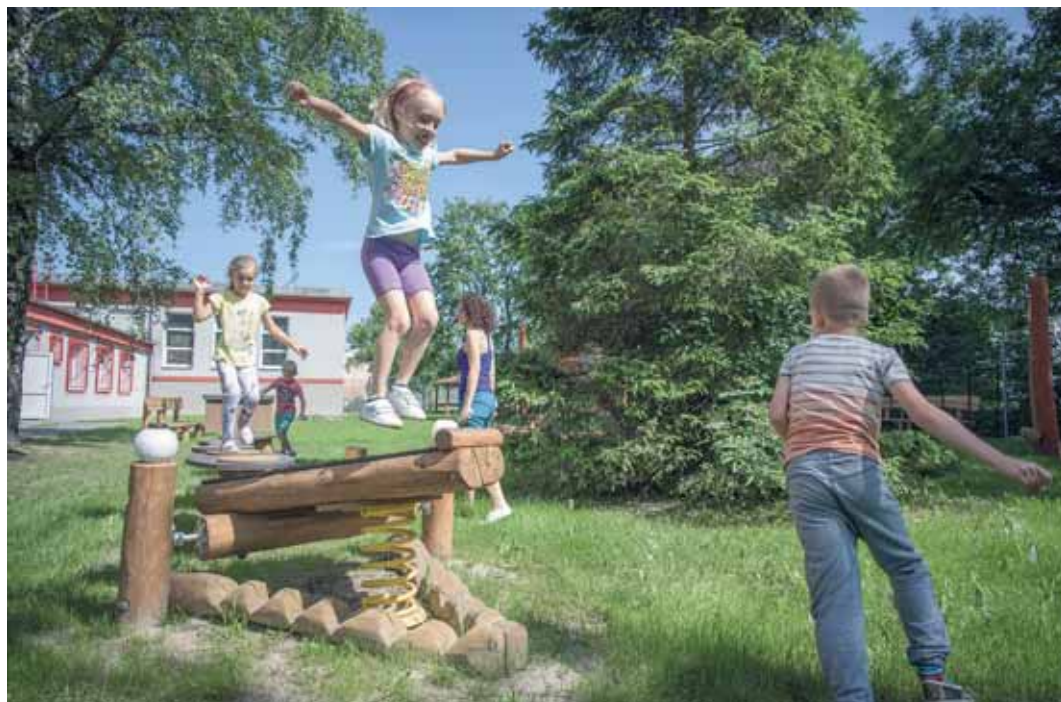
DALŠÍ HŘIŠTĚ vzniklo letos u ZŠ Provaznická díky participativnímu rozpočtu.

Díky projektu Společně tvoříme Jih!!! Vzniklo 17 hřišť a minihřišť, a to ve všech částech městského obvodu - tři v Zábřehu, po pěti ve Výškovicích a v Hrabůvce a 4 na Dubině a v Bělském