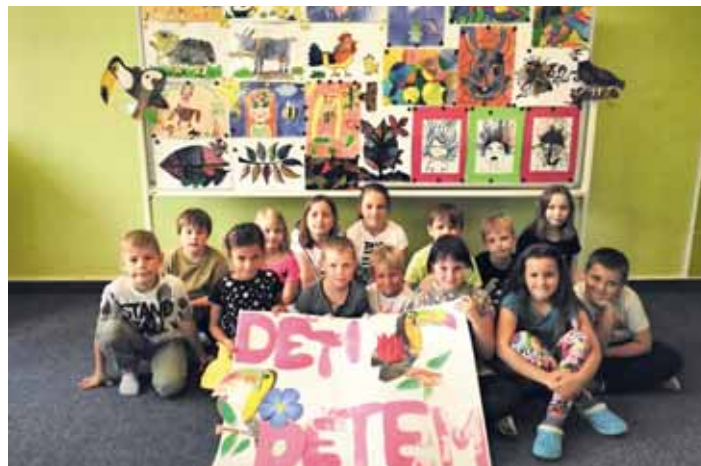
DĚTI ZŠ a MŠ Alberta Kučery