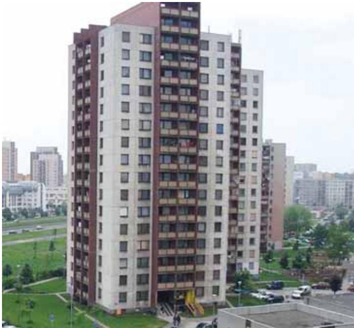
JEDNA Z MÁLA fotografií zachycující dům typu VP-OS v původním stavu (Dubina).

■ Nepřehlédnutelné a velmi zajímavé – takové jsou věžové domy VP-OS. Typické jsou především pro Bělský Les, najdeme je ale i v Zábřehu.