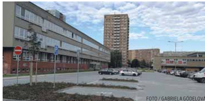
a Železnáku na ploše 4090 m 2 , proběhl za ujednaných 90 dní. Zhotovitelem stavby byla společnost STRABAG a.s.,“ uvedl místostarosta pro investice František Dehner. (gg)

„Se stavbou samozřejmě souvisela dočasná dopravní omezení, ale díky nekomplikovanému průběhu je hotovo a řidiči mohou využívat větší počet parkovacích stání, u kterých bylo upraveno i jejich uspořádání. Doba realizace této části projektu ‚Náměstí Ostrava-Jih, veřejný prostor Ostrava-Hrabůvka‘, který řešil širší lokalitu v oblasti polikliniky