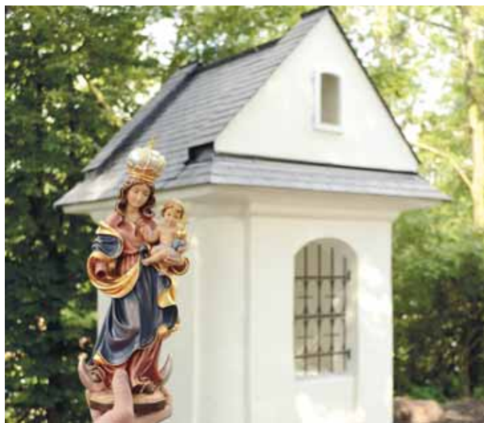
KAPLIČKA SV. JOSEFA již září novotou. Na sošku Panny Marie s jezulátkem přispěli i obyvatelé Jihu.

na opravu zvítězil v rámci obvodu na pěkném druhém místě. Rekonstrukce proběhla v červnu a předčila má očekávání. Nyní je otázkou, při jaké příležitosti kapličku „otevřít“. Velký dík patří obyvatelům Jihu, kteří na vybavení kapličky dobrovolně