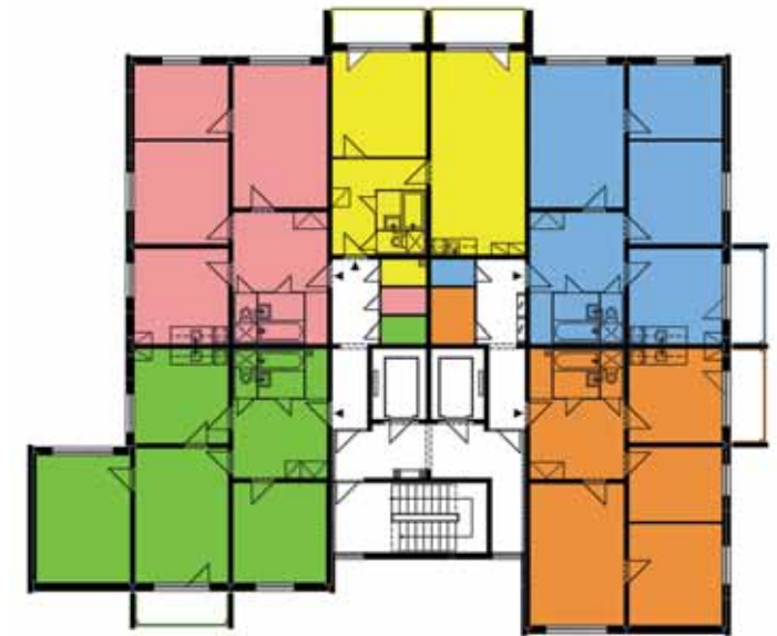
PŮDORYS panelových domů VP-OS.

mít dvě výškové hladiny. Obou těchto vlastností bylo využito v Bělském Lese na ulici Jiřího Herolda, kde se nachází největší soubor VP-OS v celé Ostravě. Domy jsou vzájemně spojeny, každý s jinou výškou, tím byla utvořena mohutná a vysoká hradba, působivě lemující okolí velkého kruhového objezdu, kolem kterého je obecně koncentrace vysokých panelových domů. Hradby z domů VP-OS ale nepůsobily rušivě, převládala bílá barva, která byla oživená červeným pruhem přes třetí, čtvrté a šesté podlaží. Červené pruhy tak krásně sjednocovaly všech šest VP-OS v lokalitě, které tak působily jako jeden ucelený soubor. Jednotný nátěr byl vlivem