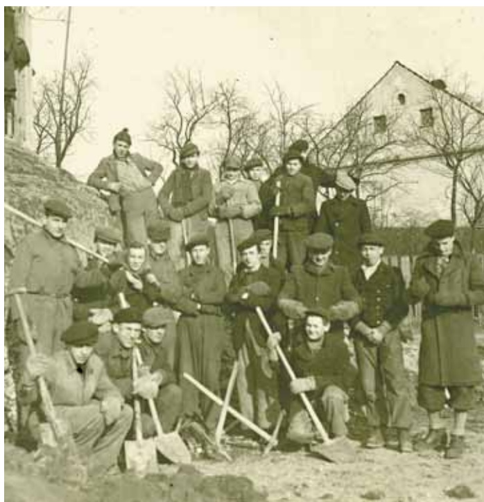
HRABOVÁ 19. ÚNORA 1945, výkop protitankového příkopu u Šidlovce.

V roce 1939 přišli Němci, ale už v roce 1938 byly obsazeny Sude-