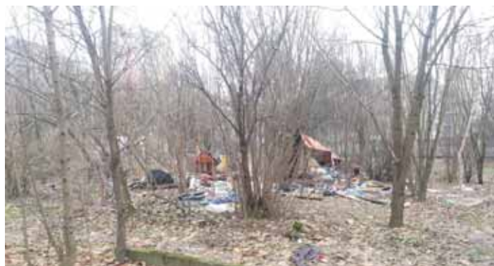
ODSTRAŠUJÍCÍM PŘÍKLADEM jsou fotografie pořízené na sídlišti Dubina.

Obracíme se proto na všechny občany, aby se vyvarovali těchto chyb a zbytečně nepodporovali svým chováním přemnožování potkanů. V roce 2017 prováděla deratizaci firma DERKIL SERVICES, s.r.o. v celkovém objemu 360 400 korun. Letošní deratizaci bude