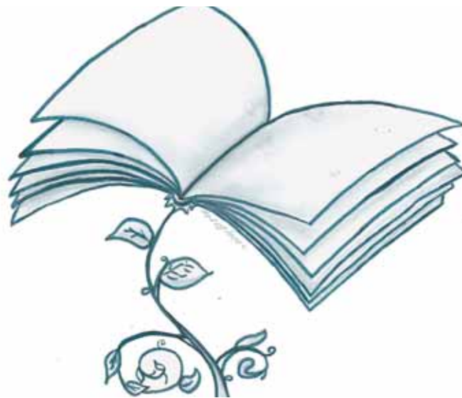
REPRO / KRESBA - NIKOL KOVALOVSKÁ, 8. TŘÍDA

knihu a další se chystala za rohem. Postupně se staly ze stostránkových knih větší, mnohem větší „bichle“. Na známky jsem se vykašlala a četla především pro sebe. Mnoho lidí má názor, že knihy za moc nestojí. Pro ně jsou lepší pouze časopisy, recenze filmů či novinky o top slavných osobnostech, hvězdách a samých drbech, co se o nich píše. Ve svém okolí se vídám s lidmi, kteří jsou na tom opačně. A čtou rádi. Nezlepšilo mi to jen slovní zásobu, ale také si dokážu přečíst, co si hlavní hrdinové třeba myslí. To z filmu nevykukám.