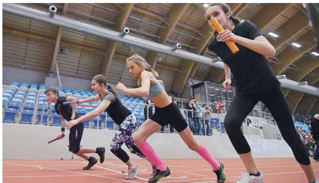
OBA POHÁRY za první místa v soutěži družstev si odnesli závodníci ze ZŠ B. Dvorského.