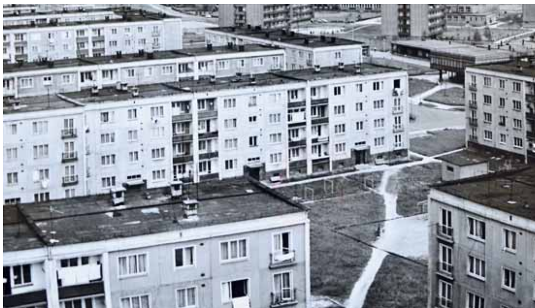
ZÁBŘEH, panelové domy G57 na ulicích Jižní a Patricie Lumumby.

Nutno podotknout, že oproti předchůdci je typ G57 diametrálně odlišný. Již není zdoben