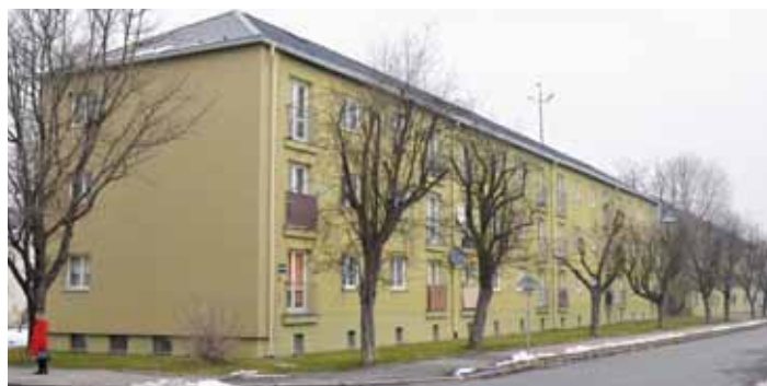
JEDNA Z PROUDOVEK na ulici Zlepšovatelů.

Ke kolaudaci 29 bloků došlo již 9. června 1951. Technický referent shledal pouze drobné závady domů: nedostatečné vysušené sklepení, nutnost doplnění komínových dvířek o zámky, dále