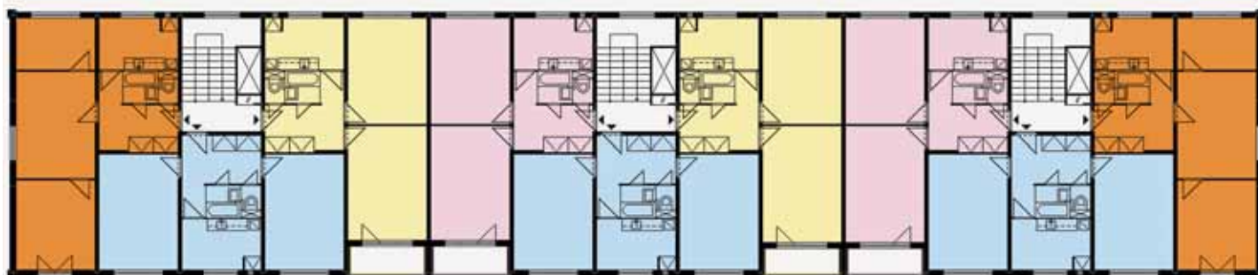
PŮDORYS: dispoziční řešení klasického panelového domu G57 o třech sekcích (Volgogradská).

Hlavní nosnou konstrukci tvoří soustava příčných nosných panelových stěn, mluvíme tedy