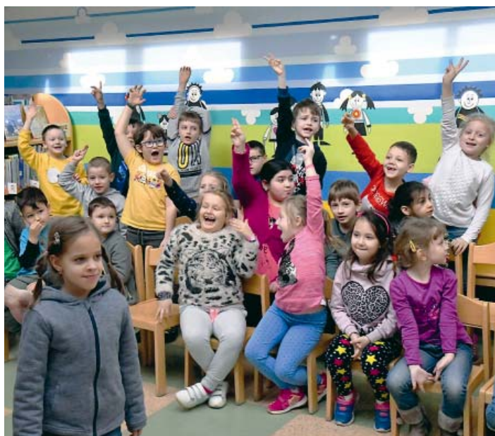
Prvňáčci se nadšeně hlásili, aby mohli splnit úkoly.