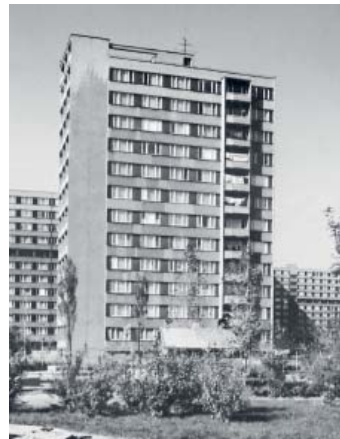
NEZNAMÁ VARIANTA věžového domu G-OS z Hrabůvky.