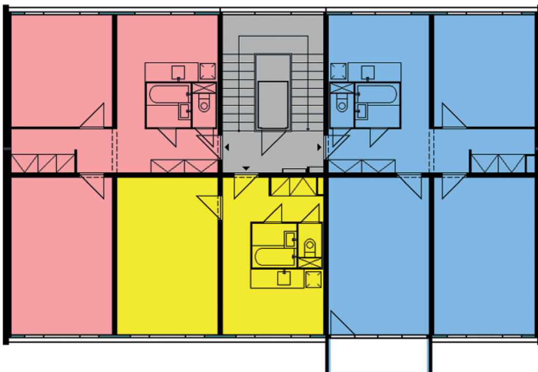
TYPICKÉ PODLAŽÍ věžového domu G-OS.