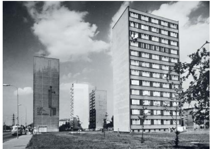
NEJVĚTŠÍ SOUBOR věžových domů G-OS je v blízkosti radnice obvodu.

Věžové domy G-OS konstrukčně nesplňují podmínky pro to být plnohodnotným věžovým do-