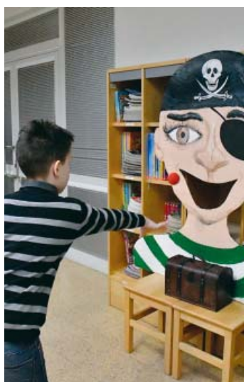
Trefit se pirátovi do úst nebylo jednoduché.