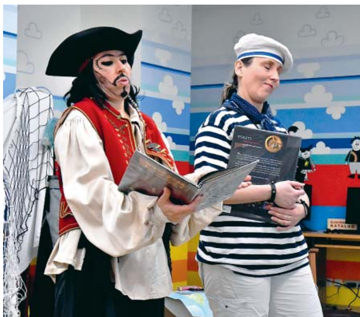
Průvodkyněmi pasování byly knihovnice.