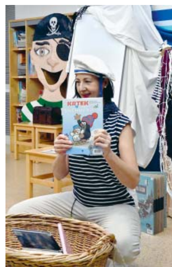
Chybět samozřejmě nemohly knihy. A byl jich celý koš.