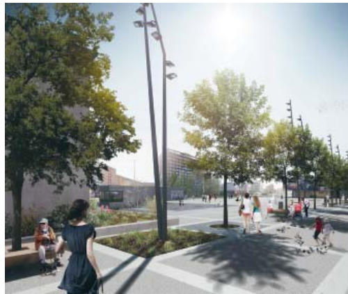
PROSTOR před obchodním centrem se promění v prostorné náměstí.