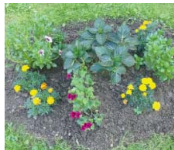
PŘEDZAHŘÁDKY zkrášlily okolí téměř třiceti bytových domů na Jihu.