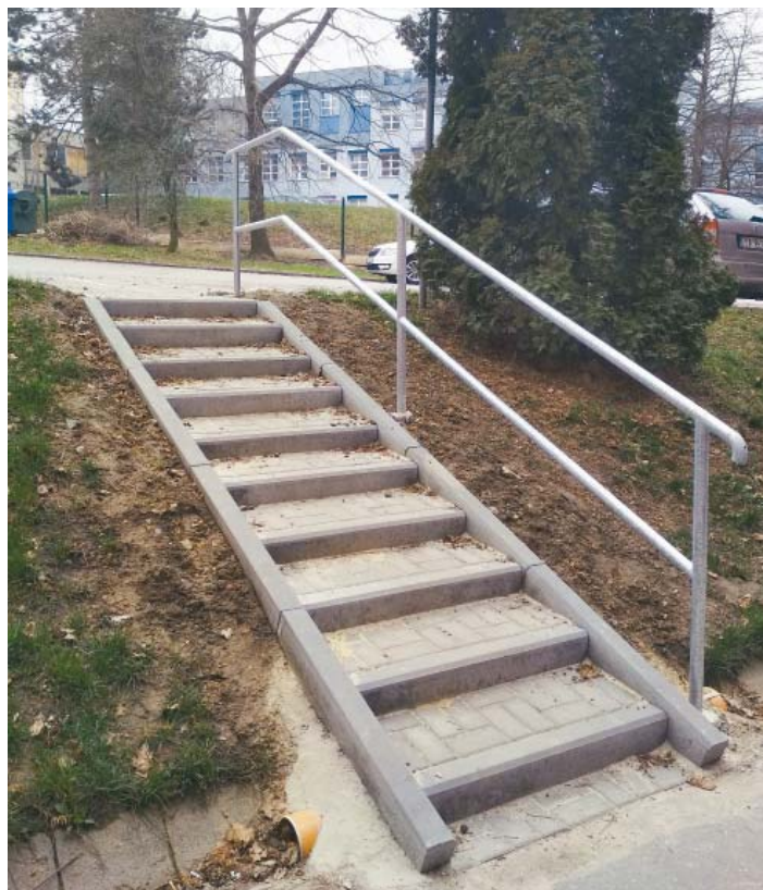
SCHODY PRO POSTIŽENÉ na Lumírově ulici ve Výškovcích jsou prvním realizovaným projektem letošního roku. Sloužit mají především hendikepovaným obyvatelům domu, kteří používají berle. Schodiště jim tak zkrátí cestu domů z parkoviště.

Společně se pustíme do hlasování a vybereme tak ty nejzajímavější projekty, které v průběhu roku 2018 zrealizujeme. Termín hlasování včas upřesníme.