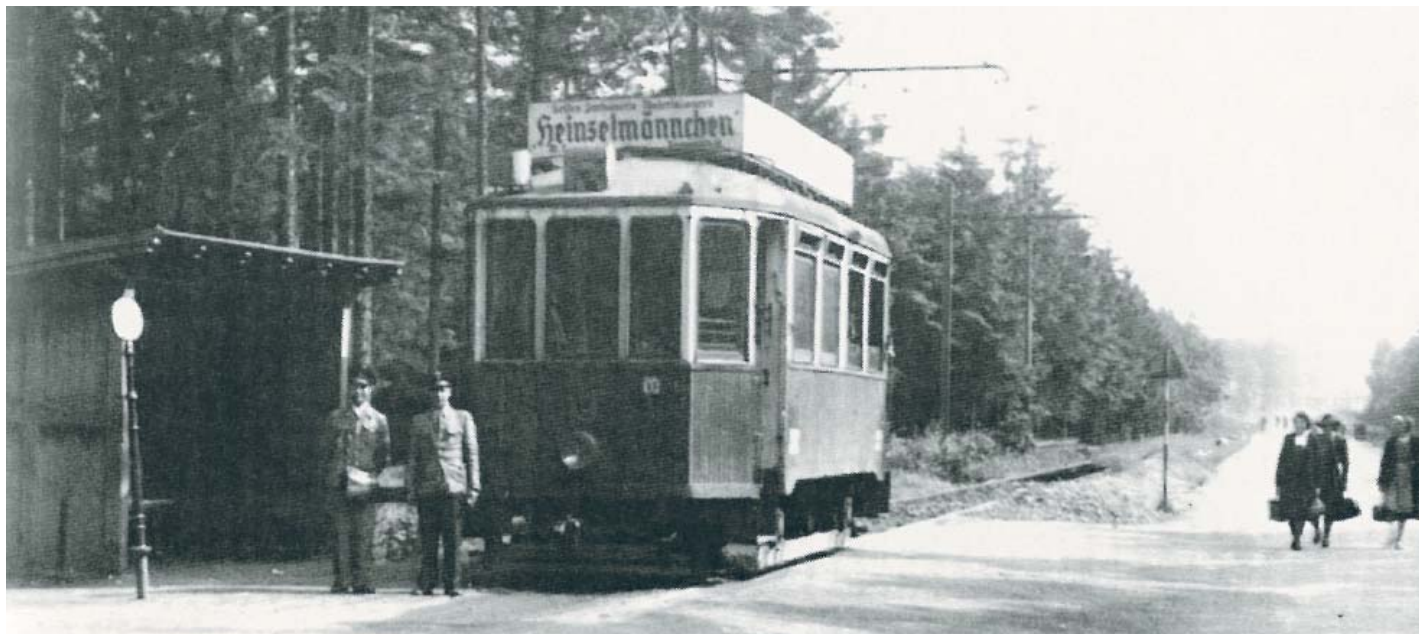
TRAMVAJ zachycená na Plzeňské ulici v Bělském lese, 40. léta.

■ V letošním roce si připomínáme hned několik kulatých výročí od zahájení dopravy na tramvajových tratích našeho obvodu. Trať vedoucí přes zábřežské Družstvo do Bělského lesa slaví nejen výročí svého zprovoznění (1929), ale také zániku (1969).