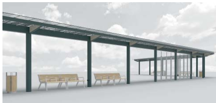
VIZUALIZACE ZASTŘEŠENÍ na přestupním uzlu.

Kromě rekonstrukce zastávek chystá Dopravní podnik Ostrava