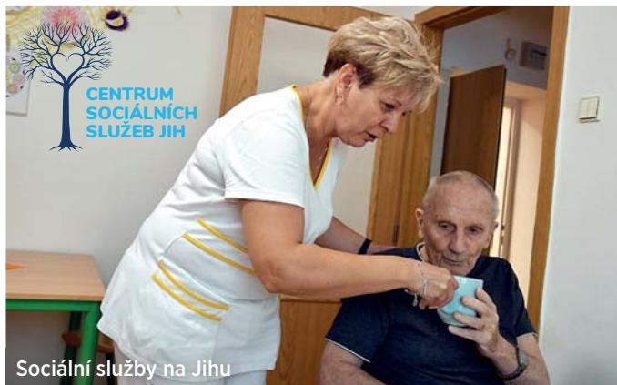
Sociální služby na Jihu

Někteří uživatelé pečovatelské a odlehčovací služby se již zapojili do Křížovkářské ligy a byli v prosinci jako úspěšní luštitelé odměněni cenami.