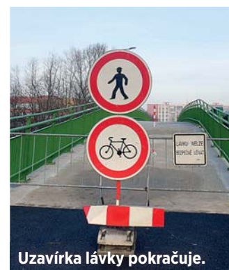
Uzavírka lávky pokračuje.