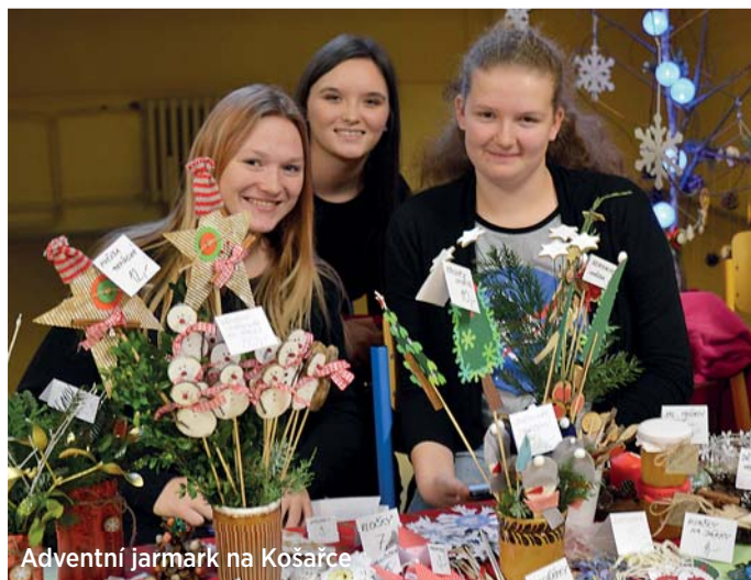
Adventní jarmark na Košaře

Adventní jarmark na ZŠ V. Košaře na Dubině se nesl i ve znamení prodeje perníčků a cukroví, které nejen žáci, ale i jejich maminky a babičky napekli pro organizaci UNICEF – Dětský fond Organizace spojených národů (OSN).