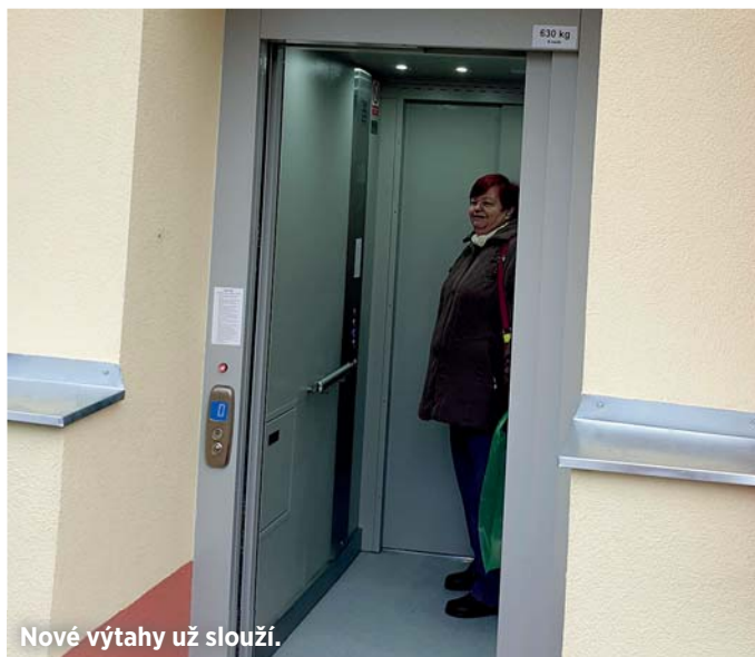
Nové výtahy už slouží.

Výtahy dostaly jedno nástupiště vybudované vždy ve venkovním prostředí, jsou tedy průchozí. „Ostatní tři nástupiště jsou umístěny v jednotlivých nadzemních podlažích domů ve společných chodbách. Vstupy dovnitř jsou na čip, který obdržel každý z ubytovaných,“ sdělila místostarostka.