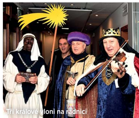
Tří králové vloni na radnici

Hospic sv. Lukáše i Mobilní hospic sv. Kryštofa s ošetrovatelskými službami ve Výškovicích jsou mezi zařízeními Charity Ostrava, na které se bude vybírat od 1. do 14. ledna. „V tomto čase vyjdou do ulic Ostravy i přilehlých obcí koledníci se zapečetěnými pokladničkami. Tříkrálová sbírka se v celostátním měřítku uskuteční po dvacáté a shromážděné příspěvky podpoří aktivity pro lidi v nouzi,“ říká Dalibor Kraut, vedoucí pro vztahy s veřejností Charity Ostrava.