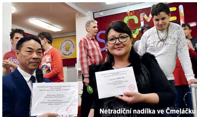
Netradiční nadílka ve Čmeláčku

V sobotu 7. prosince se v Hrabůvce v neziskové organizaci denně pečující o handicapované konala netradiční a bohatá mikulášská besídka. Zástupci vietnamské komunity totiž nadělili „čmeláčkům“ šek na třicet kilogramů sladkostí, pět kartonů polévek a peněžitý dar ve výši dvaceti tisíc korun. „Velmi si