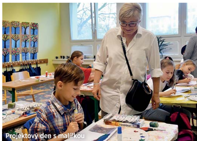
Projektový den s malířkou

Maličský projektový den, sbírka granulí, pamlsků a hraček pro psí útulek, výroba záložek do knížek a jejich výměna se slovenskými vrstevníky, hraní s rodiči a prarodiči s technickými stavebnicemi. I tím žila v posledních týdnech škola na sídlišti v Bělském Lese, jak patrně z fotografií pořízených při těchto akcích.