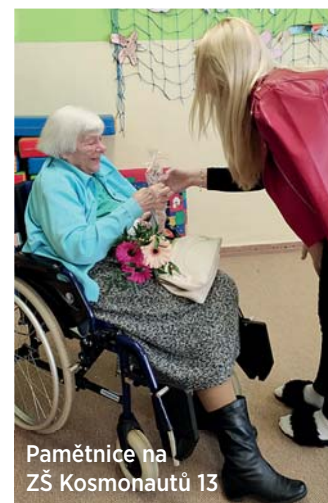
Pamětnice na ZŠ Kosmonautů 13

„Pamětnice přijala pozvání do školy, aby dětem vylíčila své životní zážitky a zkušenosti. Obohatila tak posluchače o jedinečný životní příběh a naši žáci jí za její ochotu a vyprávění poděkovali kyticí a drobným dárkem na památku,“ uvedl ředitel školy Pavel Olšovský.