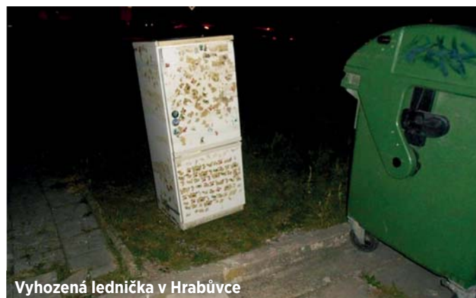
Vyhozená lednička v Hrabůvce

„Kampaň realizovaná se strážníky proti nelegálně odkládanému odpadu u kontejnerových stanovišť zřejmě zabrala. Nyní vrcholí reklamou na sociálních sítích i v médiích a vyhlášena je Fotosoutěž OZO, která bude téma odpadu u kontejnerů připomínat do května 2020,“ oznámila Vladimíra Karasová, mluvčí OZO Ostrava. Tato společnost po dobu tří listopadových týdnů záměrně neodkládala objemný odpad odložený u kontejnerů, aby si lidé lépe uvědomili, kolik nelegálně odloženého