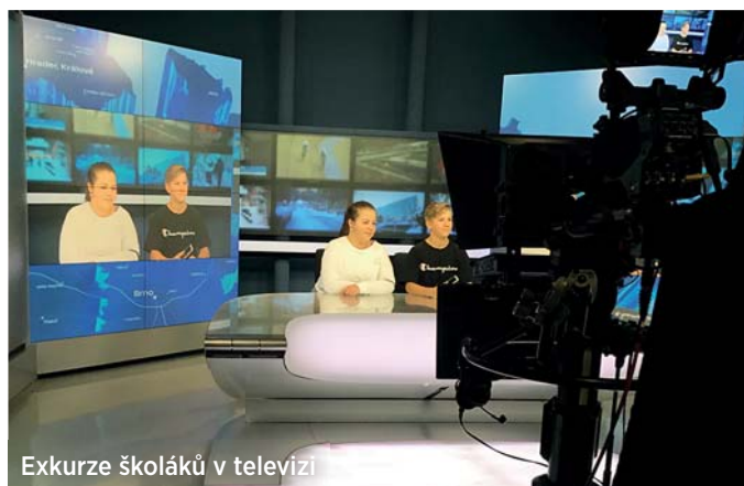
Exkurze školáků v televizi