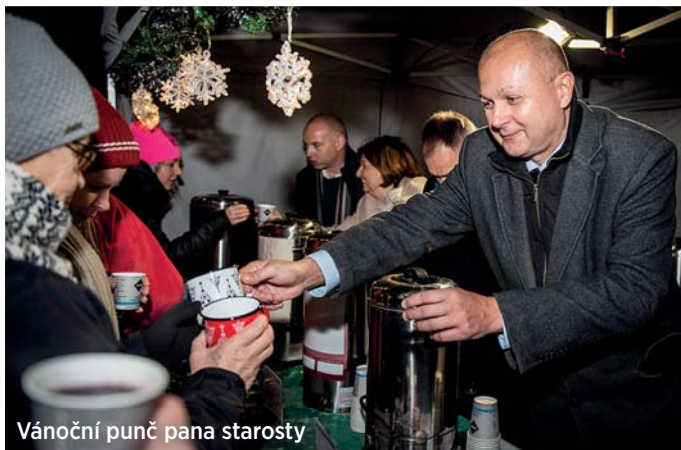
Vánoční punč pana starosty

Oblíbenou tradicí se stal Vánoční punč pana starosty, který ho v alko i nealko formě spolu s radními naléval zdarma zájemcům do kelímků i smaltovaných hrnků Jihu s PF 2020. Obvod také na místě daroval dětem CD s Čertovskými pohádkami.