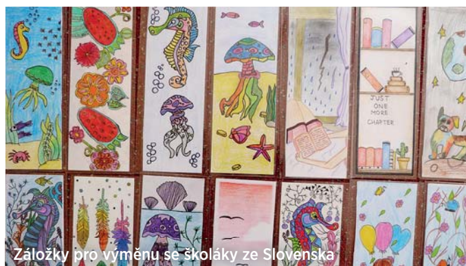
Záložky pro výměnu se školáky ze Slovenska