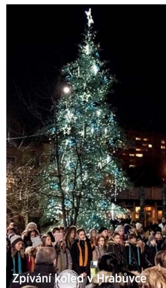
Zpívání koled v Hrabůvce