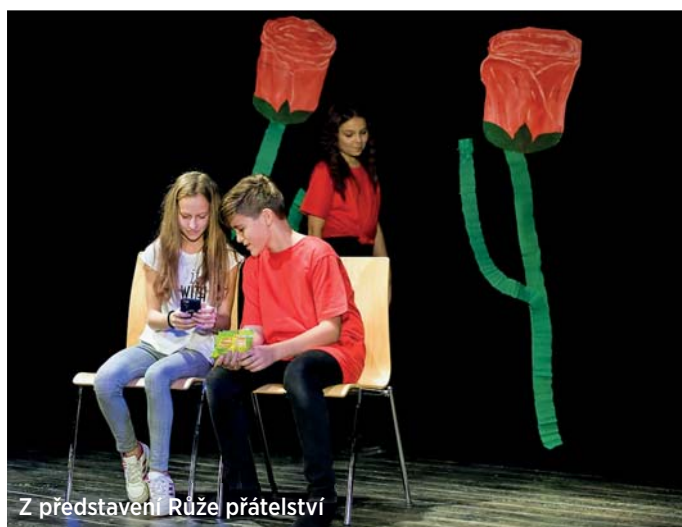
Z představení Růže přátelství

Divadelní soubor Disodor při ZŠ Chrjukinova v Zábřehu má za sebou další povedená vystoupení, tentokrát v Akordu, na téma díla Antoina de Saint-Exupéryho, autora populární knížky Malý princ.