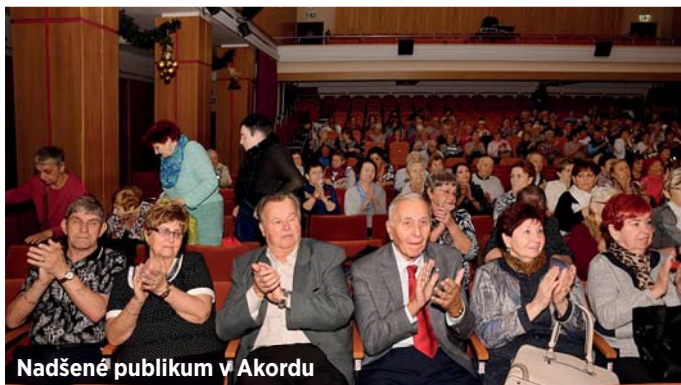
Naděšené publikum v Akordu

Jih připravuje i v roce 2020 pro starší obyvatele obvodu celou řadu akcí. Například už 7. ledna je na prvním Senior klubu v Akordu čeká přednáška oční lékařky, 15. února se mohou na stejném místě těšit na oblíbený Ples seniorů. Chystají se pro ně i zájezdy, o které je mezi seniory velký zájem, či další kulturní projekty.