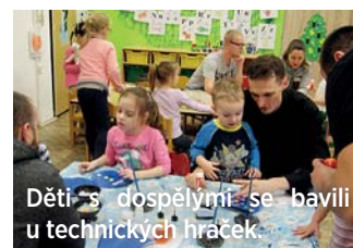
Děti s dospělými se bavili u technických hraček