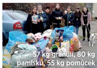
57 kg granulí, 80 kg pamlsků, 55 kg pomůcek