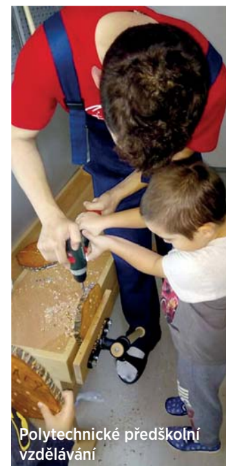
Polytechnické předškolní vzdělávání