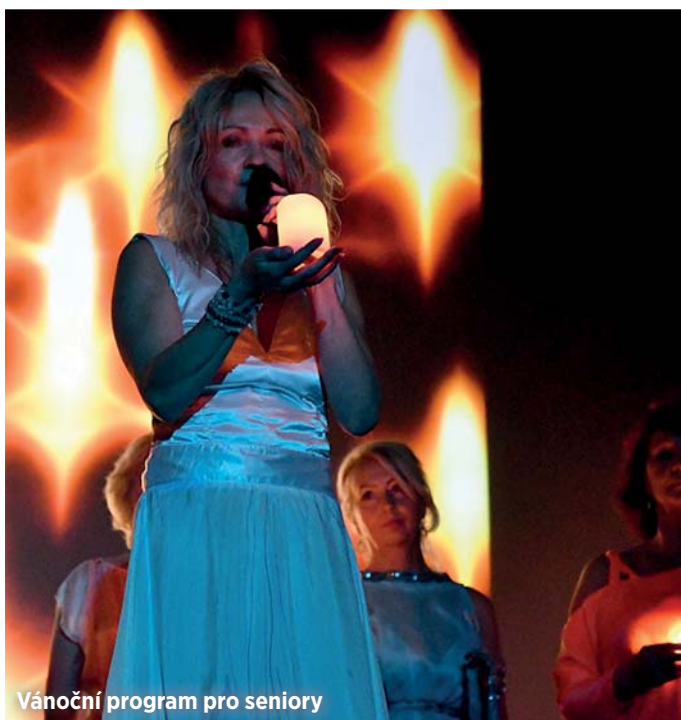
Vánoční program pro seniory

Slzy, smích i dojetí provázely předvánoční setkání seniorů, které se díky podpoře z Jihu konalo ve středu 11. prosince v kulturním domě v Zábřehu.