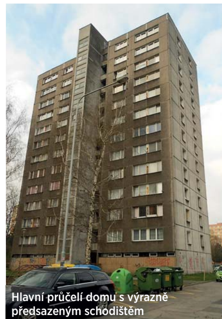
Hlavní průčelí domu s výrazně předsazeným schodištěm