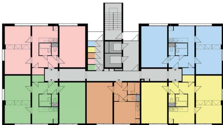
Typické podlaží domu B12, povšimněte si cesty ke schodišti skrz lodžii.