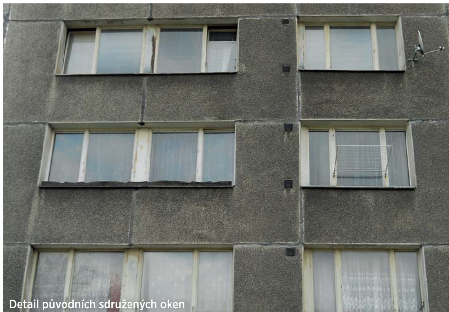
Detail původních sdružených oken

V dnešním díle si představíme šestici věžových domů, která se nachází v okolí ulic Stadická a Oráčova na jihovýchodní části sídliště Hrabůvka. Výška všech šesti věžových domů s označením B12 je dvanáct nadzemních podlaží a jedná se tak o výškové dominanty dané lokality. Výšku věžových domů B12 umocňuje i okolní zástavba, která dosahuje vesměs výšky čtyř nadzemních podlaží. Domy byly vystavěny začátkem 70. let, a jedná se tak o jedny z nejstarších věžáků Hrabůvky.