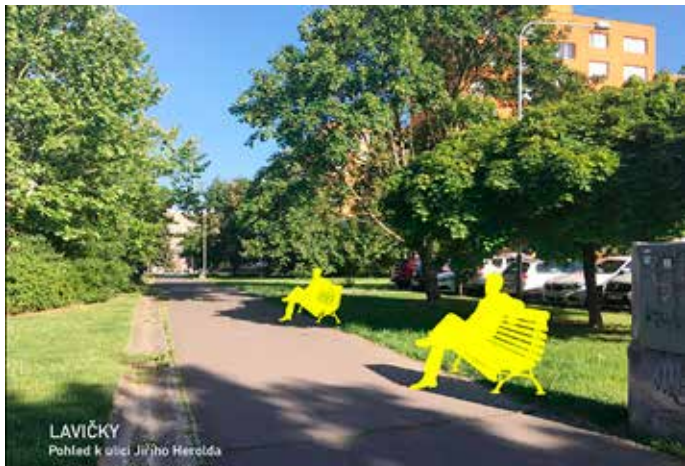
Obyvatelé ulice Františka Lýska a okolí se mohou těšit na lavičky pro odpočinek.

Osmý ročník participativního rozpočtu je téměř u konce. Na přelomu října a listopadu se rozhodovalo o návrzích, které prošly technickou analýzou. Zapojilo se 7 362 hlasujících, kteří se svým názorem vyjádřili k tomu, co dalšího má vzniknout na Jihu.