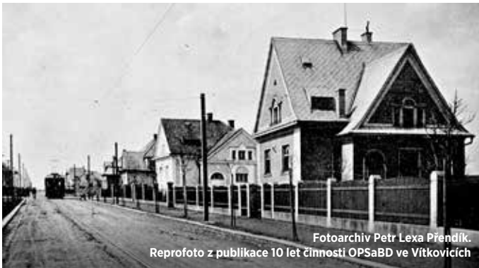
Fotoarchiv Petr Lexa Přendík. Reprofoto z publikace 10 let činnosti OPSaBD ve Vítkovicích

Vila č. p. 711 na dnešní ulici Rudná, kterou si nechali postavit manželé Chalupníkoví.