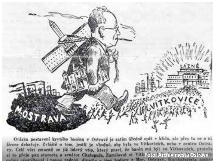
Sarkastická karikatura Josefa Chalupníka

Josef Chalupník se narodil 9. května 1884 ve východních Čechách v Proseči, v obci ležící na půli cesty mezi Vysokým Mýtem a Chrudimí. Dětství neměl lehké, vyrůstal jako nemanželské dítě v péči své matky, služky v Proseči. Získal jen základní vzdělání, ale byl pilným samoukem a četbou se mu podařilo deficit ve vzdělání vyrovnat.