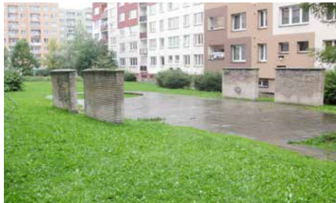
Z obvodu byla odstraněna spousta betonových prostranství.

Projekt REPLACE – Zeleň místo betonu byl k poslednímu říjnu ukončen.