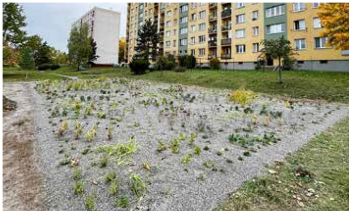
Na ulici Markova už byly vysazeny trvalkové záhony.