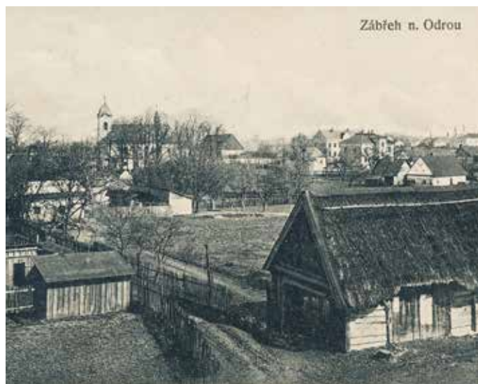
Podoba Zábřehu nad Odrou na počátku 20. století

Situace využila také správní komise Vítkovic, která si začala klást další požadavky. Dokonce začala jednat o vytvoření tzv. Velkých Vítkovic, které by vznikly sloučením Vítkovic, Zábřehu nad Odrou a Hrabůvky. Ani tentokrát nedosáhly samosprávy konečného výsledku.