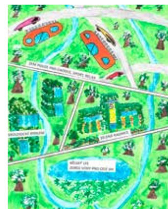
ZŠ Březinova – Zelený Jih