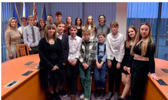
Poslední loňské setkání Parlamentu mládeže Ostrava-Jih se konalo 13. prosince.

Od října loňského roku začal fungovat Parlament mládeže Ostrava-Jih žáků šestých tříd a starších. Deseti setkání se zúčastnilo 34 žáků.