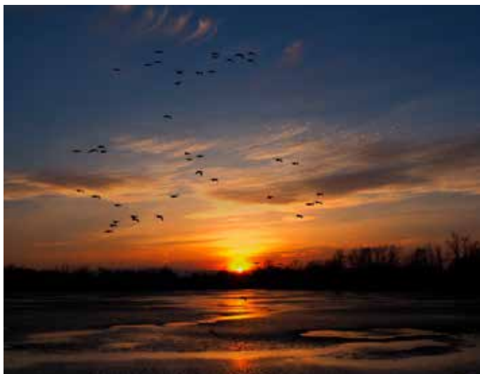
Ilona Hromádková nazvala svou fotografii Večerní soumrak .

Už počtrnácté se konala fotografická soutěž, kterou za finanční podpory městského obvodu Ostrava-Jih pořádají Střední průmyslová škola v Zábřehu a Asociace středoškolských klubů České republiky. Hlavním tématem právě skončeného ročníku byla večerní fotografie. Organizátoři vybírali ze 452 snímků. Nejzdařilejší fotografie jsou v lednu vysta-