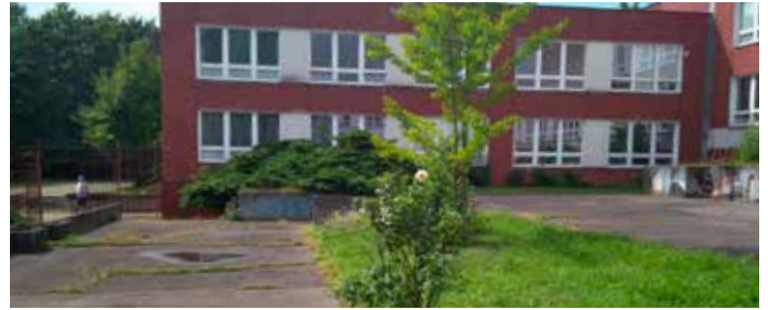
Prostor atria před rekonstrukcí...

Atrium, workoutové hřiště i výcvikový areál pro dobrovolné hasiče jsou z důvodu větší bezpečnosti návštěvníků pod dohledem kamer napojených na městskou policii.