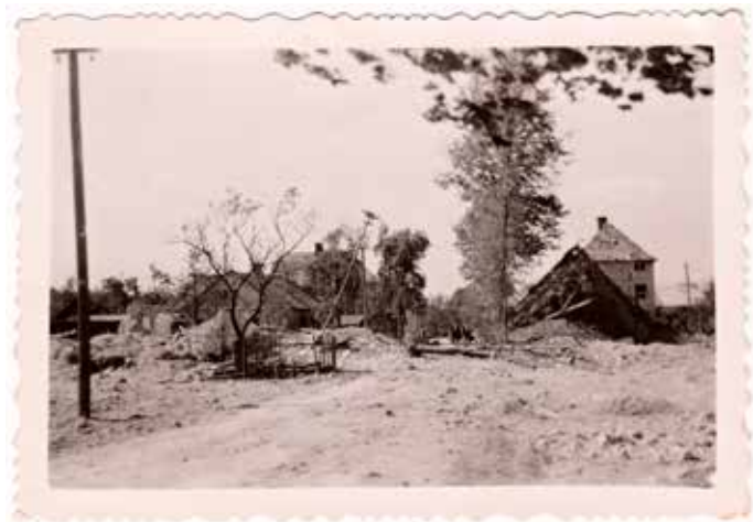
Oblast ulice v Troskách po náletu z 29. srpna 1944

První a zároveň nejtěžší nálet postihl Ostravu 29. srpna 1944, kdy v pěti vlnách udeřilo na město směrem od jihu na severovýchod během jedné hodiny čtyři sta amerických bombardérů typu B24 Liberator 15. letecké armády USA. Letouny vzlétly ze základny v jiohitalském Bari. Američané podnikali toho dne nejprve nálety na vedlejší klamné cíle, jejichž smyslem bylo odvést pozornost německé protivzdušné obrany od skupiny letounů, která mířila na Ostravsko. Hlavním cílem destrukcí měly být zdejší průmyslové závody. Letecký poplach byl v Ostravě vyhlášen v 10.45 a skončil v 11.55 hodin. Vlny bombardérů směřovaly od Výškovic přes Zábřeh, Vítkovice a Moravskou Ostravu k Přívozu a Slezské Ostravě a dál směrem na Bohumín.