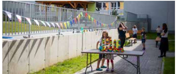
... a po přestavbě