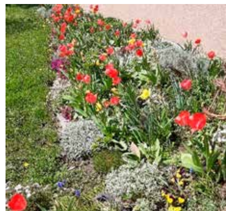
Věra Kalusová, Proskovická 45, Ostrava-Výškovice

že v průběhu let náklady na pořízení rostlin vzrostly, rozhodlo vedení obvodu příspěvek navýšit, a to na 1 500 korun,“ dodal Šimík. To, že se investice do předzahrádek vyplatí, dokazují příjemci dotace fotografiemi, které na zahrádkách plných květin pořizují. Podrobné informace o dotaci jsou k dispozici na webu: ovajih.cz .