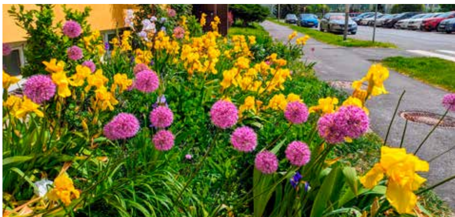
Neznámý zakladatel předzahrádky na Františka Formana 39, Ostrava-Dubina

Na zvelebení 57 předzahrádek poskytla loni radnice 85 tisíc korun. V letošním roce je možné opět o dotaci na zkrášlení prostoru před svými domy požádat, a to až do 31. října. Stejně jako v loňském roce je výše příspěvku 1 500 korun.