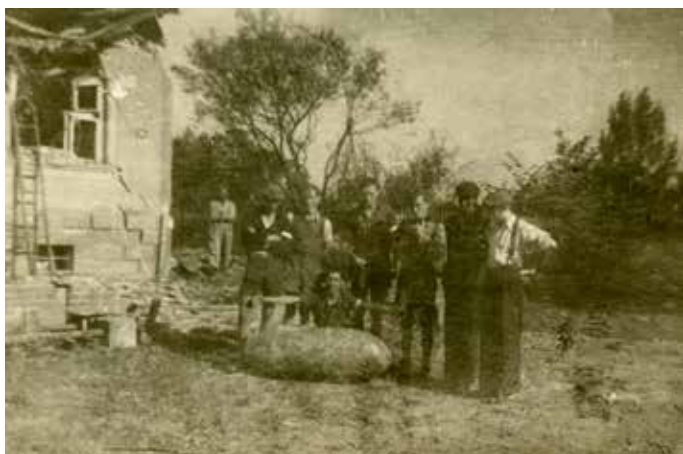
Letecká puma v zahradě jedné z vilek na nynější ulici V Troskách, 29. srpna 1944

Nejničivější destrukci v Zábřehu dodnes připomíná název ulice V Troskách. Původně se ulice od roku 1932 nazývala Hollarova. Nálet ze srpna 1944 zůstal z hlediska ztrát na životech nepřekonán i přes to, že spojenecká i sovětská letadla zaútočila na město do konce