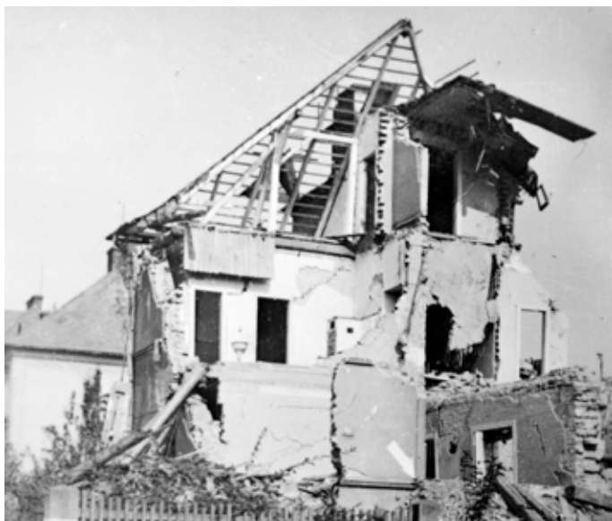
Jedna ze zábřežských vil zasažena pumou, 29. srpna 1944

války ještě třicetkrát (při všech náletech zahynulo 150–200 osob, při třinácti dalších náletech nebyl nikdo usmrčen).