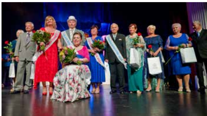
Vítězové loňského ročníku

O vítězce osmého ročníku soutěže Miss babča a vítězi čtvrtého ročníku Štramák roku se rozhodne 26. září v DK Akord v Zábřehu. Porota bude vybírat z osmi žen a sedmi mužů, kteří se dostali do finále. Akce je