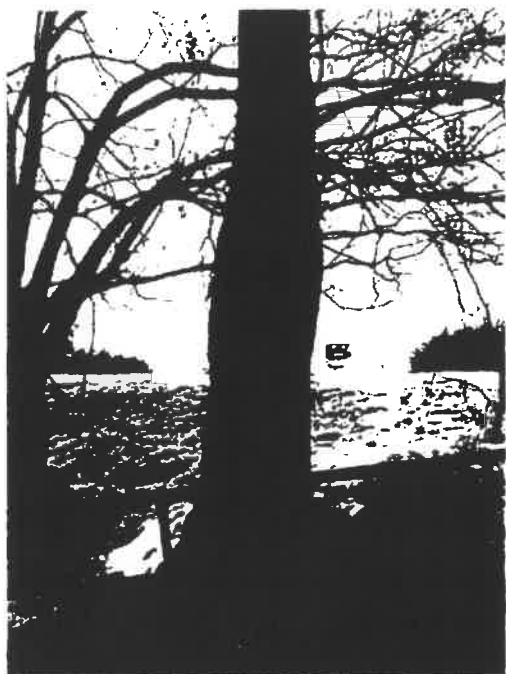
Výškovická ul. podchod u OC. Populus nigra 227 cm